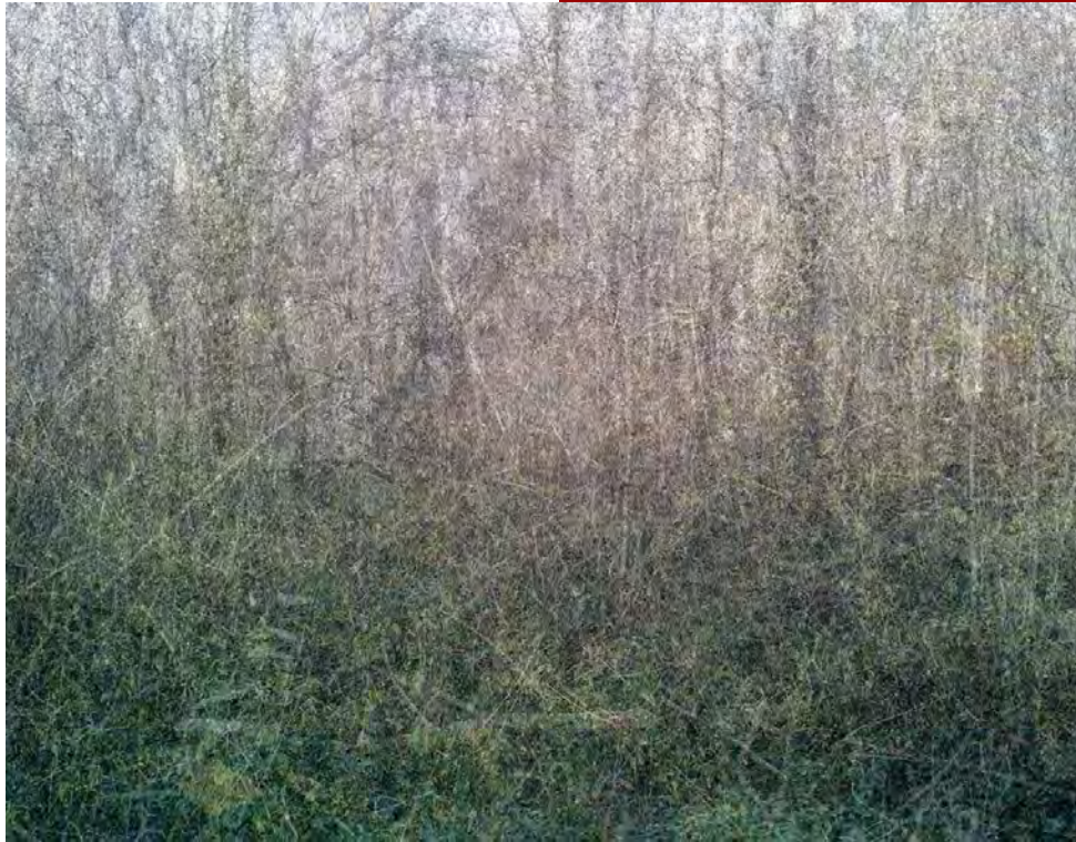
© Hideyuki Ishibashi Projet Trails Image : 23/11/2020, 13:55-15:01, Bois Parisien