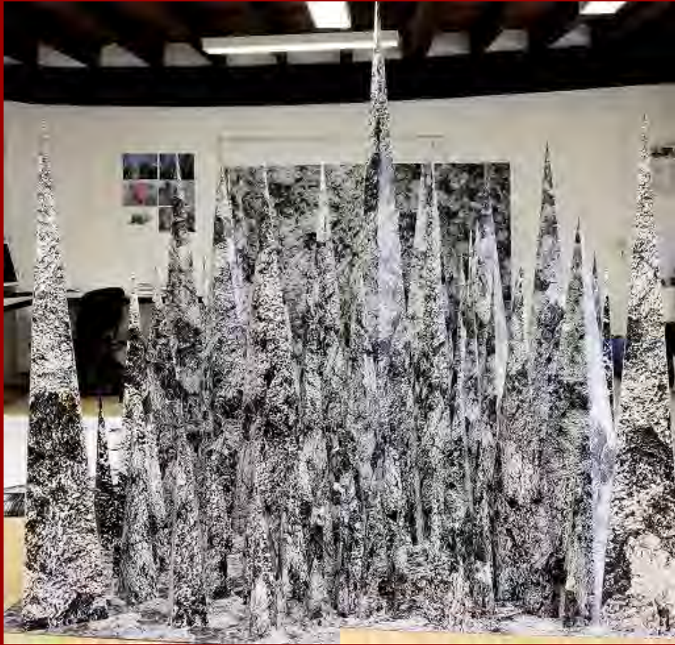
© Anais Lelièvre « Vue d'atelier » Résidence Bourges-Le Subdray