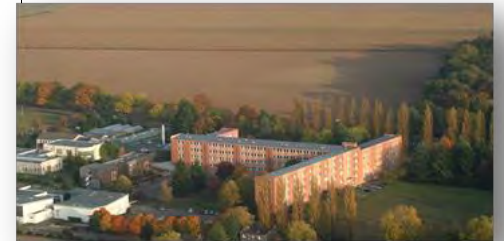
Lycée agricole de Tours Fondettes