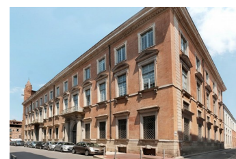
Hôtel Saint-Jean, Toulouse