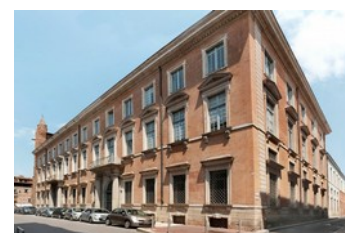
Hôtel Saint-Jean, Toulouse