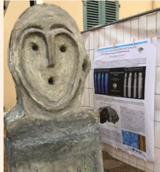
Atelier JEA 2021 Ajaccio