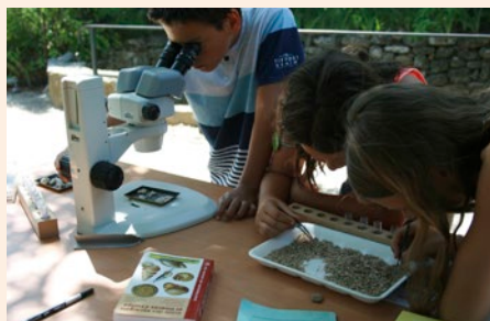
Atelier de malacologie