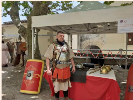
La Légion VIII Augusta lors des JEA 2021

La Légion VIII Augusta vous propose d'accéder au campement militaire réunissant légionnaires et officiers (toute la journée) et de découvrir différents ateliers présentant l'armée romaine.