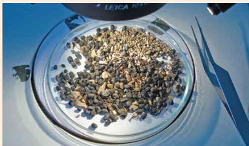
Etude des graines en laboratoire

Inrap: Isabel Figueiral (archéobotaniste)