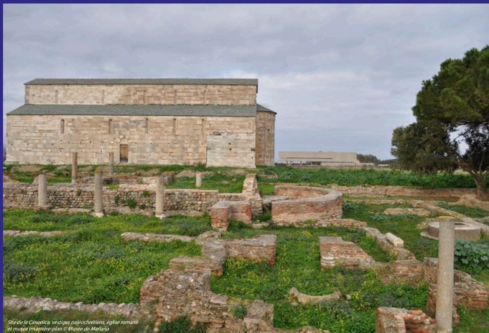
Site de la Cànonica, vestiges paléochrétiens, église romane et musée en arrière-plan

Village de l'archéologie musée de site archéologique de Mariana