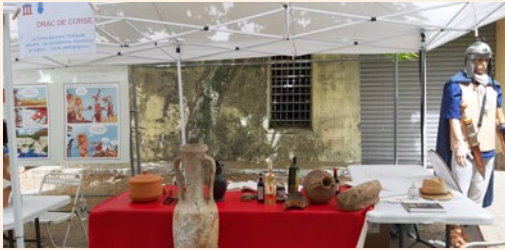
Atelier valise pédagogique antique

DRAC de Corse - Service régional de l'archéologie