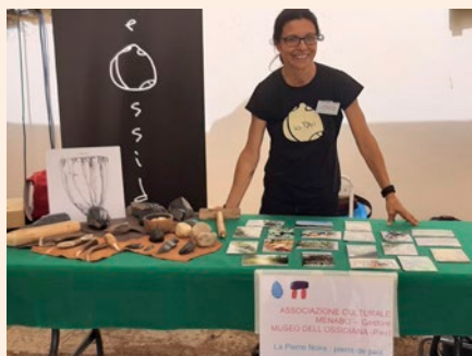
Atelier ASSOCIAZIONE CULTURALE MENABO'

ASSOCIAZIONE CULTURALE MENABO' – gestore museo dell'ossidiana (Pau): Giulia Balzano (archéologue – éducateur de musée), Emanuela Meloni (collaboratrice pour la traduction et la documentation des activités)