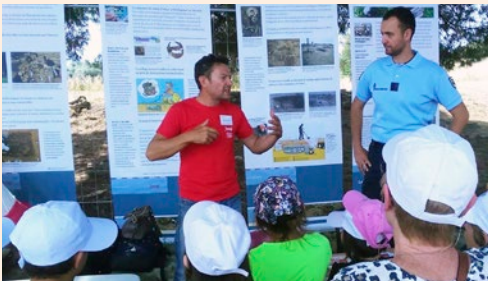
Atelier de prévention des biens archéologiques aux JEA 2021

Le saviez-vous? L'archéologie est un métier: c'est ce dont il sera question dans cet atelier animé par les différents acteurs insulaires de la protection du patrimoine. Citoyens, élus, étudiants ou simples curieux pourront poser leurs questions et trouver les réponses directement auprès d'un archéologue et d'un gendarme.