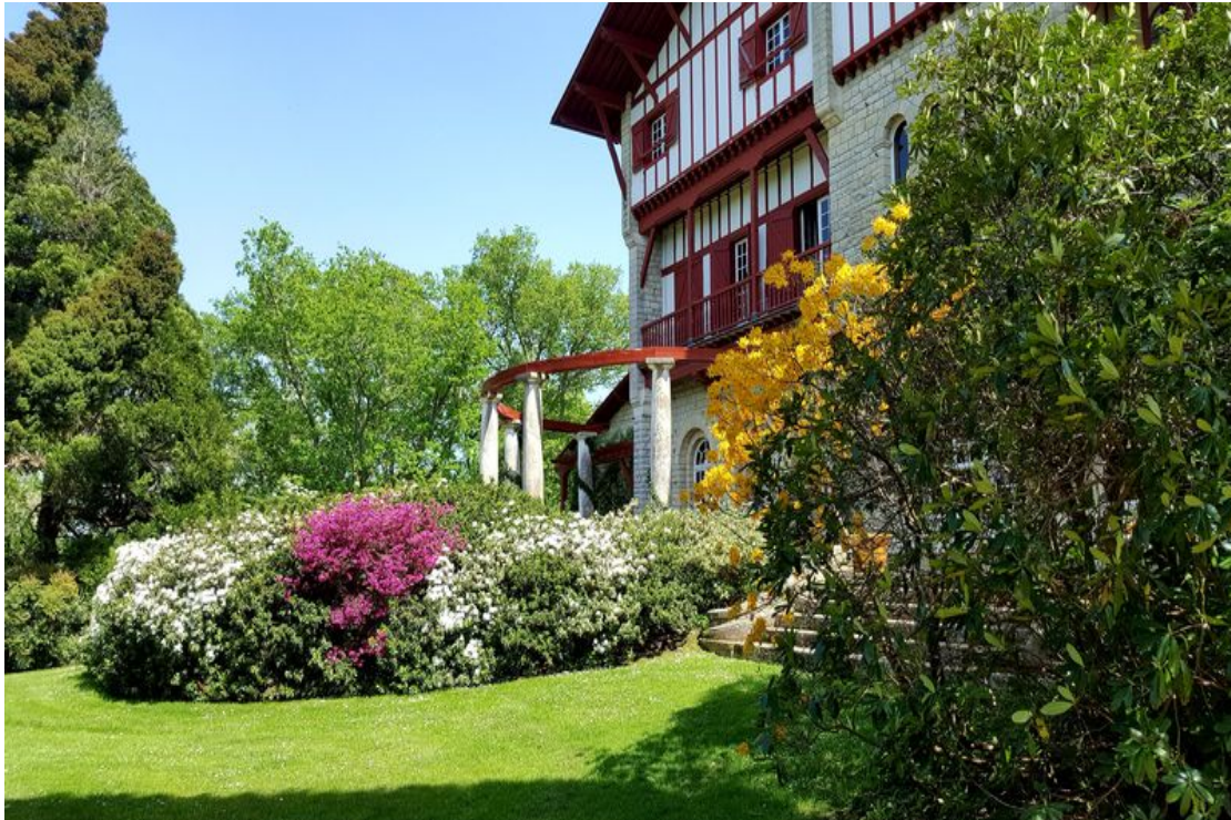
Cambo-les-Bains – Jardins de la Villa Arnaga

Les horaires et tarifs signalés dans ce programme sont donnés suivant les informations transmises par les propriétaires ou gestionnaires des jardins au 22 mai 2023.