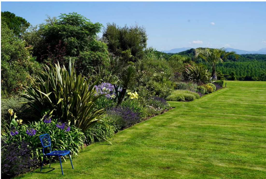
Saubrigues – Le Jardin des Barthes

Les horaires et tarifs signalés dans ce programme sont donnés suivant les informations transmises par les propriétaires ou gestionnaires des jardins au 22 mai 2023.