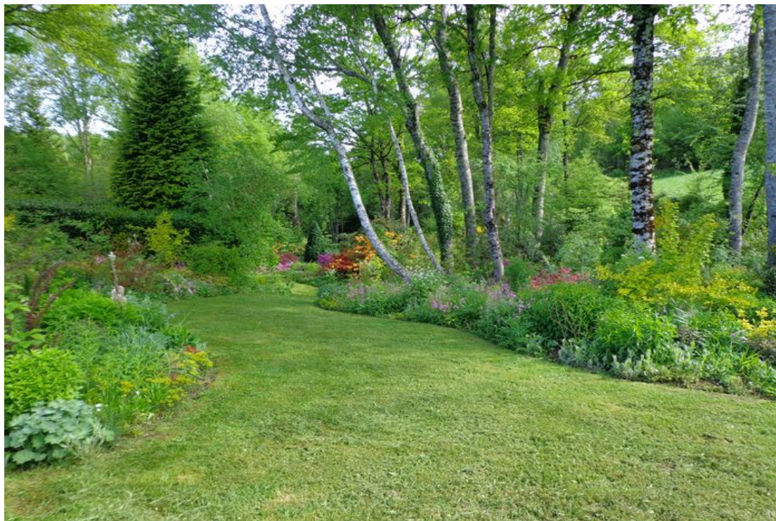
Latronche – Le jardin des Bois

Les horaires et tarifs signalés dans ce programme sont donnés suivant les informations transmises par les propriétaires ou gestionnaires des jardins au 22 mai 2023.