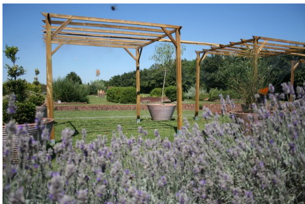
Chassenon Jardin de Pline l'ancien – Cassinomagus

Sam et dim 10h-17h : Quizz la musique et les plantes. Venez tester vos connaissances avec ce petit quizz spécialement conçu pour les rendez-vous aux jardins sur le thème des plantes et de la musique. Répondez aux questions présentes directement dans le jardin et essayez de gagner un plant d'une des plantes du jardin ! Jeu sans supplément au tarif d'entrée, en accès libre sur les horaires d'ouverture.