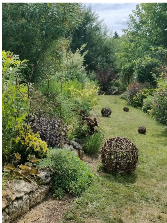
Jardins de Laussagne

06 01 21 89 37 ou 06 62 74 22 35 - www.lesjardinsdelaussagne.com