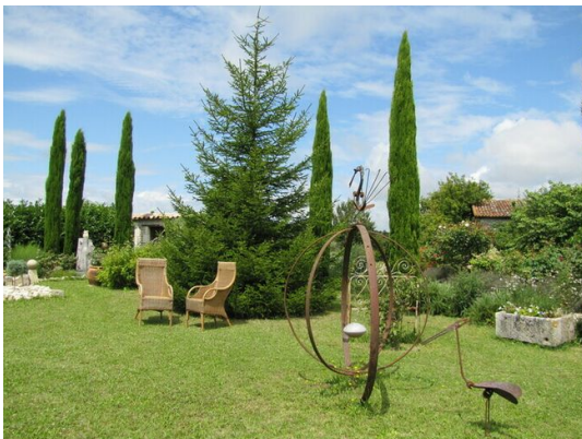
Jardin de Chrismô

Créé en 2010 sur un terrain agricole, le jardin présente une grande diversité d'arbres, rosiers, arbustes et vivaces, privilégiant couleurs et parfums. Un bassin et un cours d'eau artificiels qui font le bonheur des oiseaux, insectes et batraciens animent ce lieu. L'ensemble se distingue par des espaces successifs originaux qui surprennent le visiteur et lui permettent tout au long du parcours de se reposer et méditer, tout en profitant du paysage lointain où se profile un moulin à vent en état de marche.