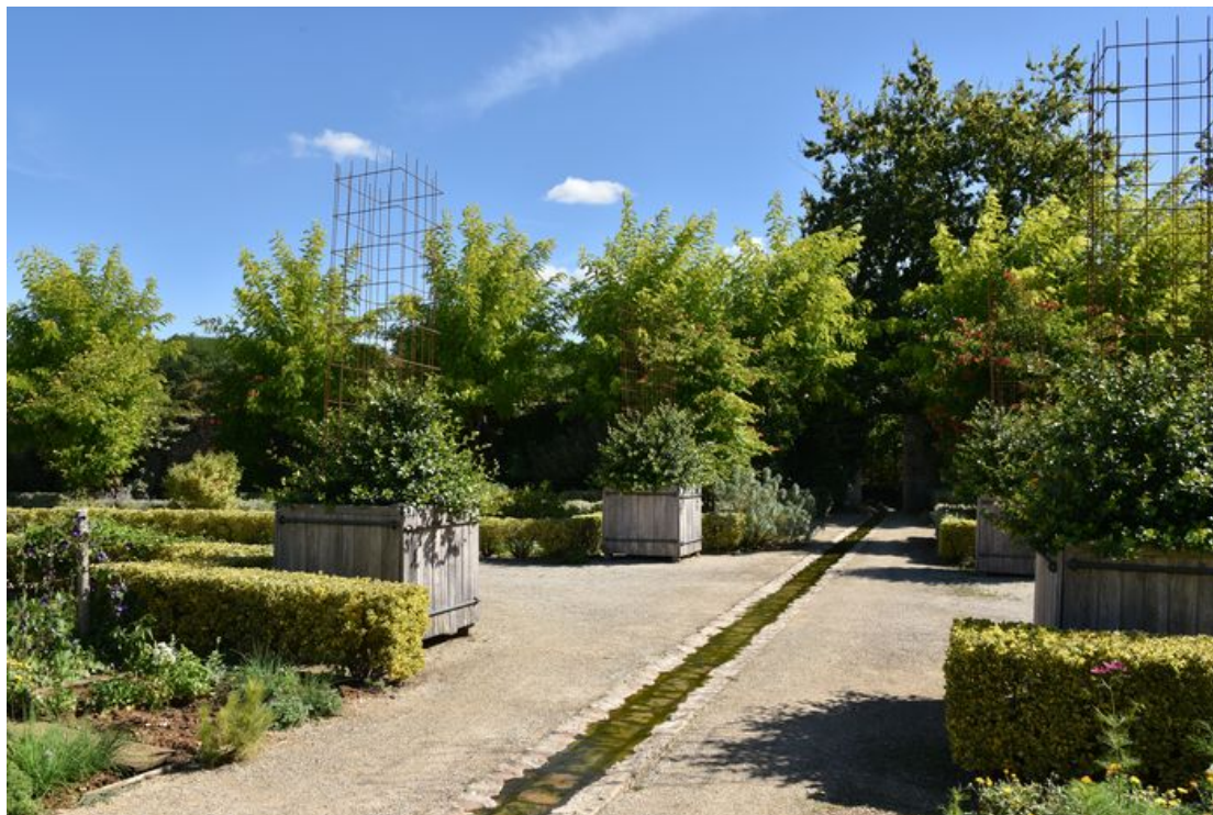
Bioussac – Parc et jardin de l'Abrègement

Les horaires et tarifs signalés dans ce programme sont donnés suivant les informations transmises par les propriétaires ou gestionnaires des jardins au 22 mai 2023.