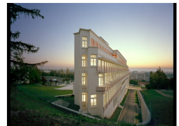
Sanatorium de Sabourin