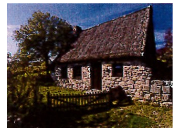
Site classé des Hautes Chaumes

Église Notre Dame du Port à Clermont-Ferrand au titre des chemins de Compostelle