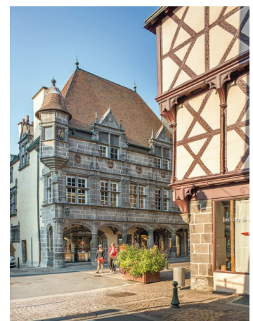
Maison des Consuls à Riom