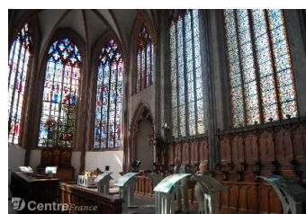
Sainte-Chapelle de Riom