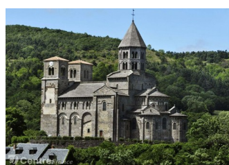
Eglise de Saint-Nectaire