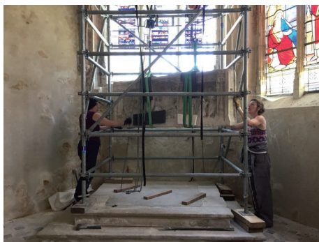
▲ 28 - Église Notre-Dame de Bû - dépose du retable