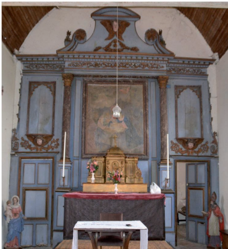
▲ 28 - Gommerville - Retable du maître-autel (avant) : Atelier Jean-Marc Darde