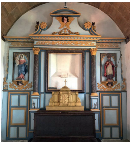
▼ 28 - Gommerville - Retable du maître-autel (après) : Atelier Jean-Marc Darde