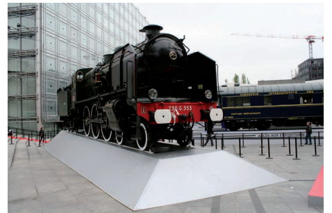
▲ 41 - Gièvres - Locomotive - Inauguration IMA expo Orient express 03/04/2014