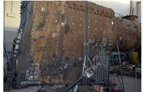
▲ 41 - Gièvres - Loco 230 G 353 (en cours - Côté D) 2016-2021