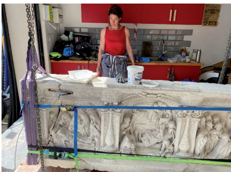
▼ 28 - Le retable dans l'atelier de restauration

La Conservation régionale des monuments historiques (CRMH) envoie un formulaire de demande de subvention, accompagné de la liste des pièces nécessaires, dont la réception enclenchera l'instruction de la demande et précise le taux de subvention susceptible d'être appliquée.