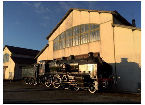
▲ 41 - Gièvres - Loco 230 G 353 (après) 2016-2021