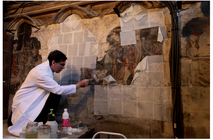
45-Cathédrale d'Orléans, restauration peinture sacristie