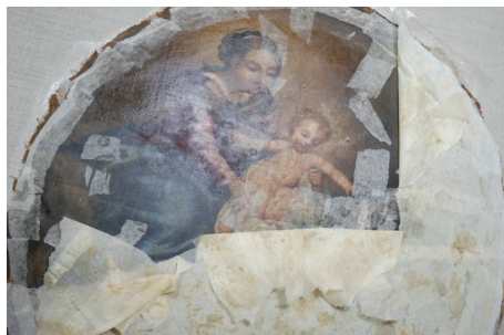
◀▲ Eglise Saint-Martin d'Olivet (45)