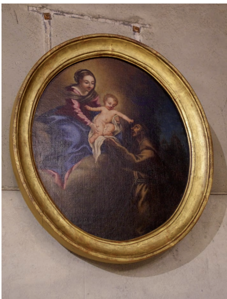
▲ Eglise Saint-Martin d'Olivet (45)