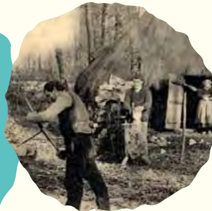
Hutte de sabotiers en forêt, vers 1900. (AD22, 16 Fi 1021/42)

Spécialiste de la Bretagne à l'époque ducale, Yves Coativy reviendra sur l'importance de la forêt pour la société médiévale : comment la gestion des forêts était encadrée par l'administration ducale, comment le bois et les autres produits de la forêt étaient exploités et dans quelle mesure les intérêts divergents pouvaient entraîner des conflits d'usage.