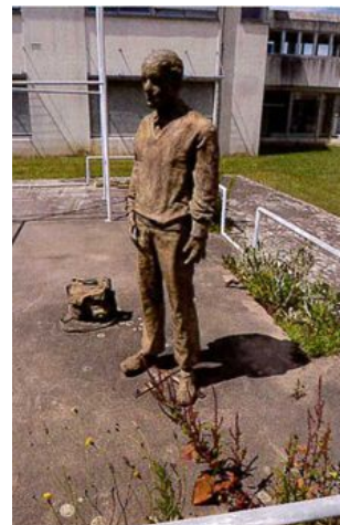
© Julien Boureau - CAO A 85

Titre de l'œuvre J'habite au 11 Descriptif Architecture en toile d'aluminium Artiste BARTO Bernard et Clotilde Année de réalisation 1982