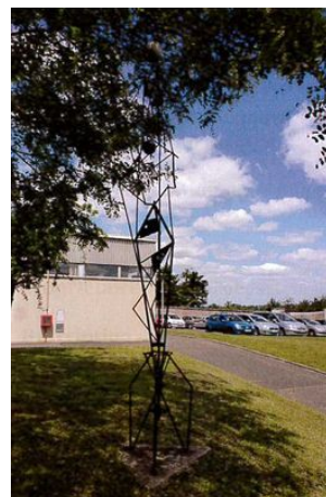
© Julien Boureau - CAO A 85

Descriptif Colonne légère et souple en forme de fusée. Métal soudé et peint Artiste DEMAN Albert Année de réalisation 1971