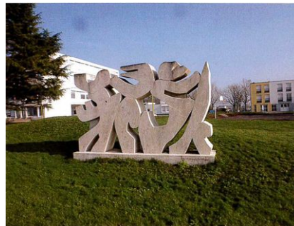
© Julien Boureau - CAO A 85

DRAC des Pays de la Loire Service des arts plastiques et des métiers d'art 1 rue Stanislas Baudry BP 63518 44035 Nantes cedex 01 02 40 14 23 67 arts-plastiques.paysdelaloire@culture.gouv.fr