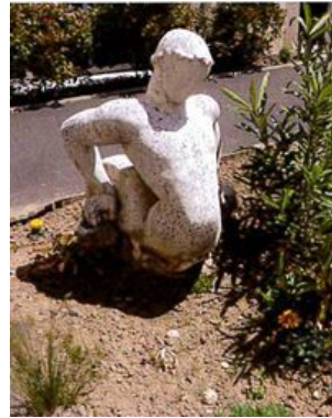
© Julien Boureau - CAO A 85

LA ROCHE-SUR-YON Lycée Pierre Mendès France 17 Boulevard Arago 02 51 36 87 87