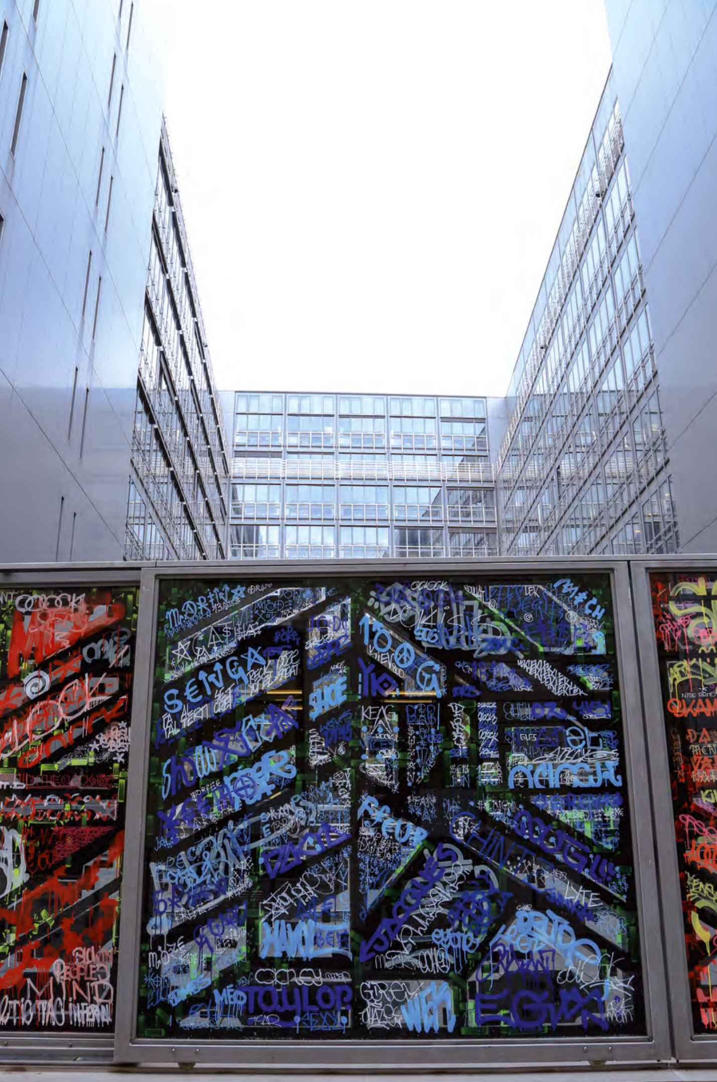
Oxymores, exposition-intervention au ministère de la Culture, œuvre de Jacques Villeglé, O'Clock, Lek et Sowat, 2015 © C. Diaz