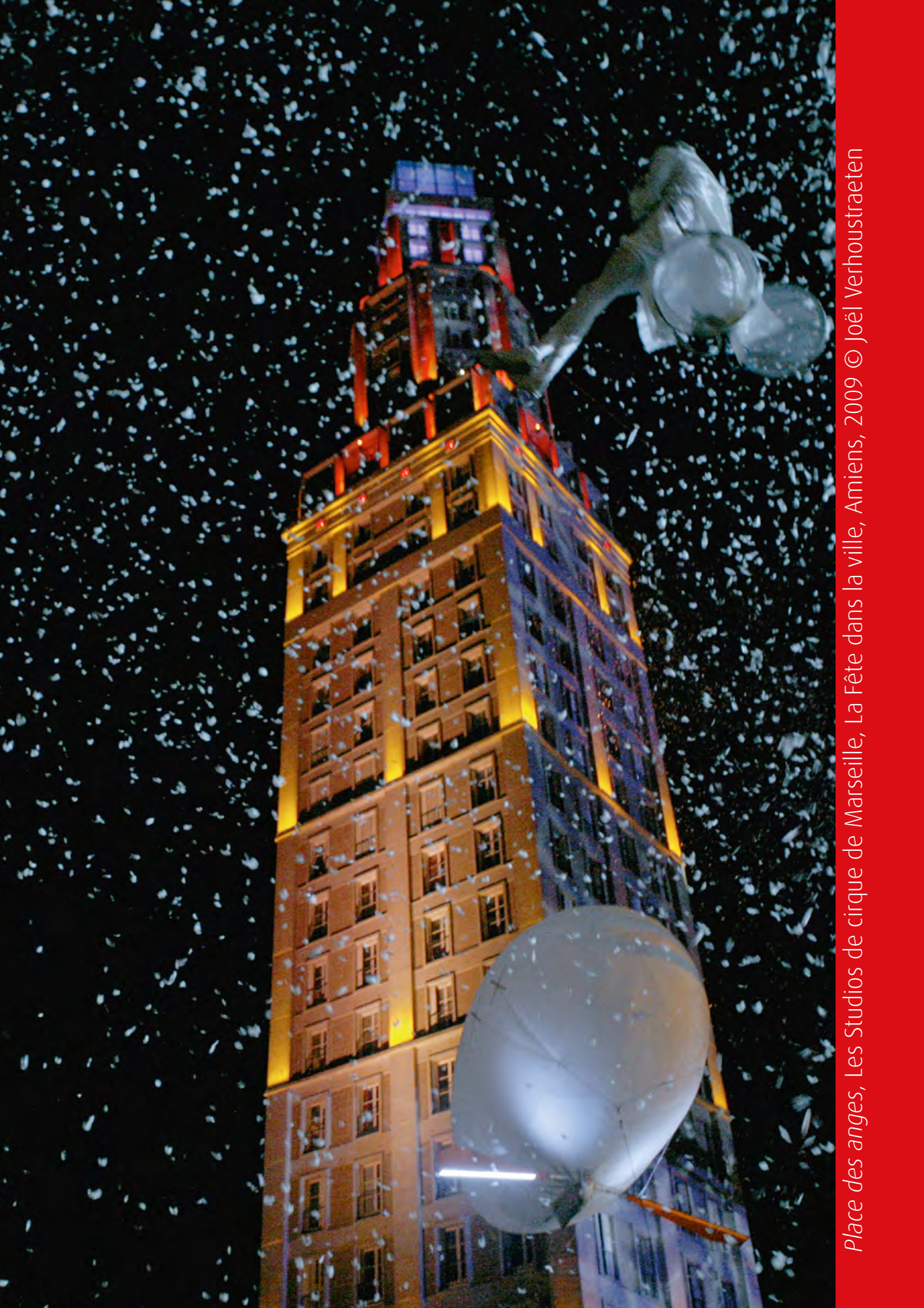
Place des anges, Les Studios de cirque de Marseille, La Fête dans la ville, Amiens, 2009