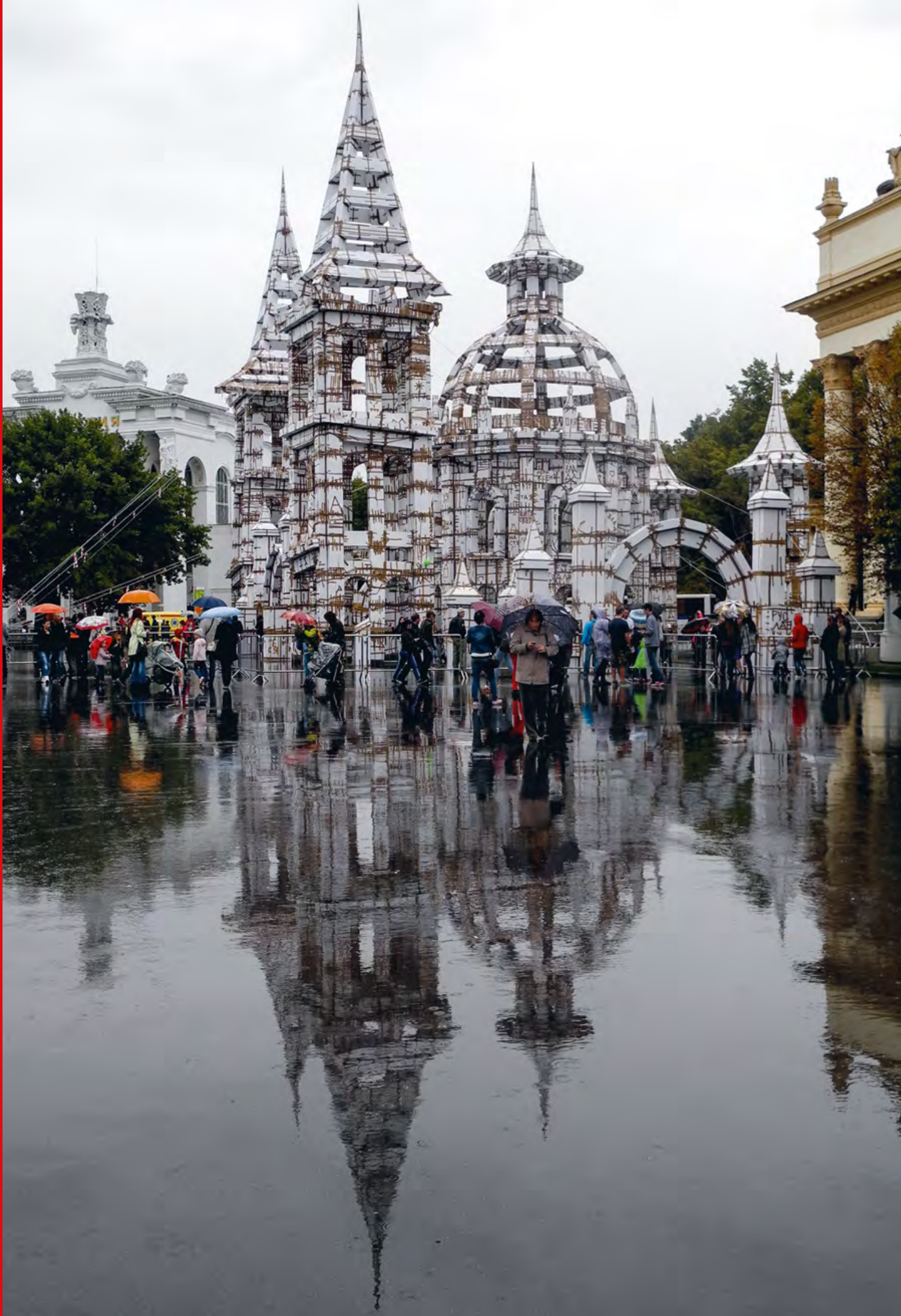
Installation monumentale d'Olivier Grossetête, Moscou, 2015 © Olivier Grossetête