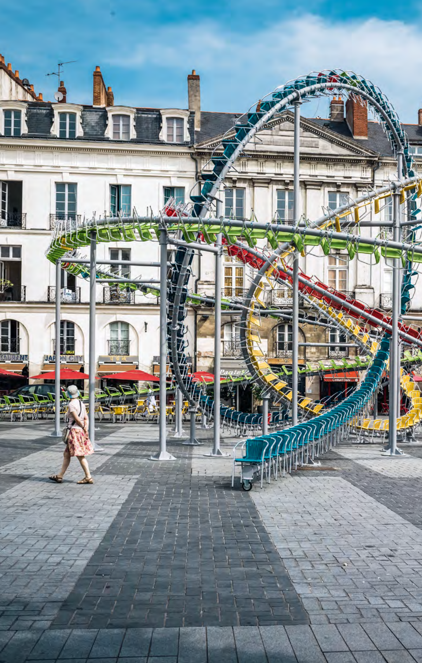
Stellar, Baptiste Debombourg, place du Bouffay, dans le cadre du Voyage à Nantes, 2015