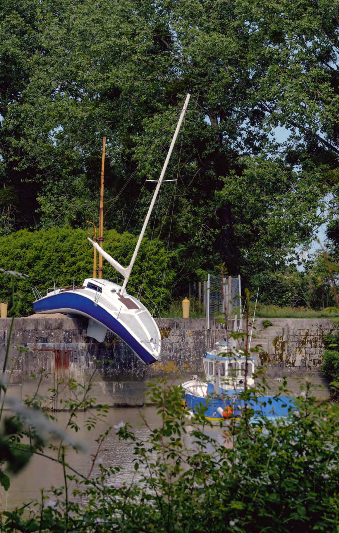
Misconceivable, Erwin Wurm, Canal de la Martinière, Le Pellerin, création pérenne Estuaire, 2007