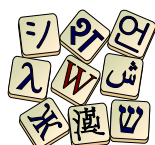
Wiktionnaire Le dictionnaire libre

Le Dictionnaire des francophones rassemble diverses ressources à son lancement, bientôt suivies de nombreuses intégrations dans les mois à venir : l' Inventaire des particularités lexicales du français en Afrique noire (AUF), le Wiktionnaire francophone , le Dictionnaire des synonymes, des mots et expressions du français parlé dans le monde (Académie des sciences d'Outre-Mer), Le Grand Dictionnaire terminologique (OQLF), l'ouvrage Belgicisms - Inventaire des particularités lexicales du français en Belgique (Conseil International de la Langue Française), le Dictionnaire des régionalismes de France (ATILF), et la Base de données lexicographiques panfrancophone (Université Laval), FranceTerme (DGLFLF) - en cours d'intégration. Les trois premières sont diffusées sous licence libre CC BY-SA 3.0 tandis que les quatre suivantes sont diffusées sous licence CC BY-SA-ND 4.0.