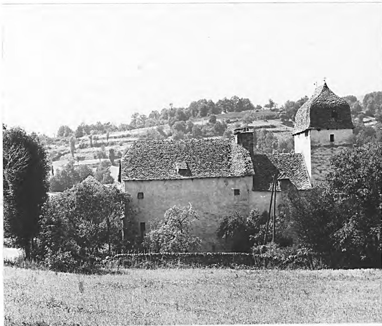
n° 68.48.1238 X Ph. Inv. Pénn 93 48 516XA