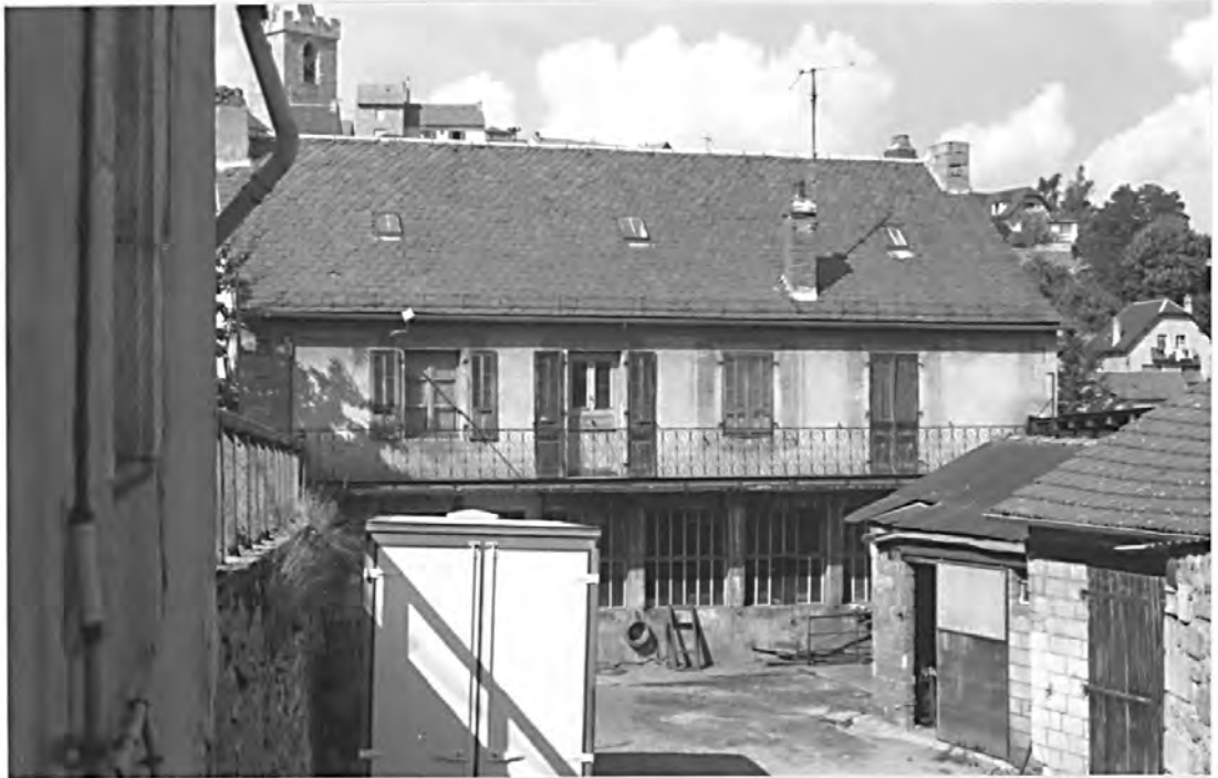
Atelier de mécanique Meyronin