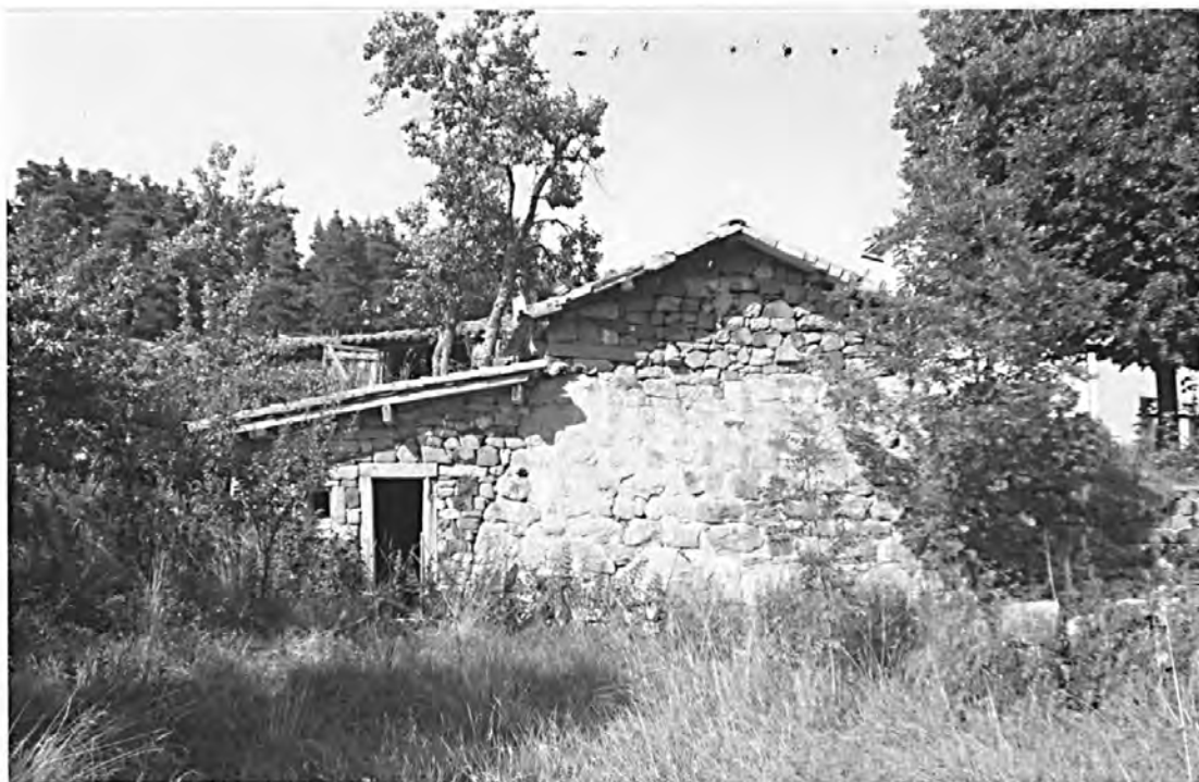
Four, séchoir et logement patronal