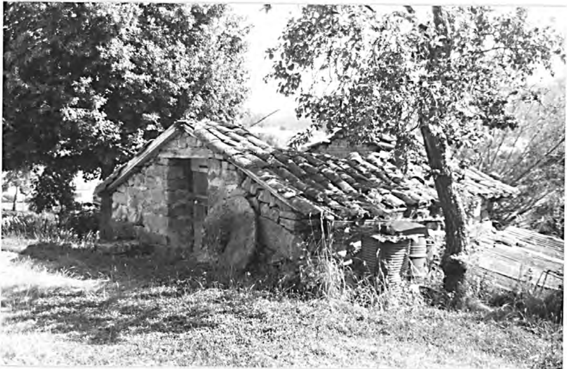
Bâtiment du four, intérieur.