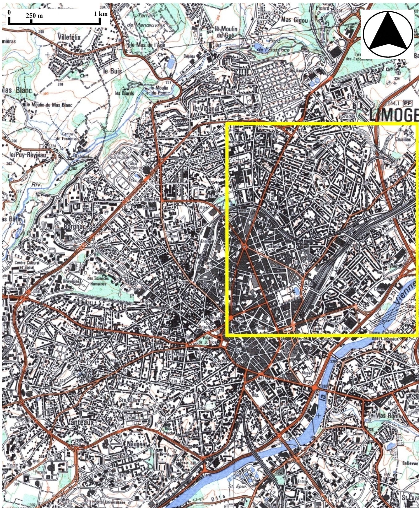
Des.1 Plan de localisation : faubourg Nord-Est de Limoges. Carte topographique, 2001, 1 : 25 000°, IGN, Scan 25®, F051-058.

Usine de chaussures Hayon, puis imprimerie Les Presses Rapides