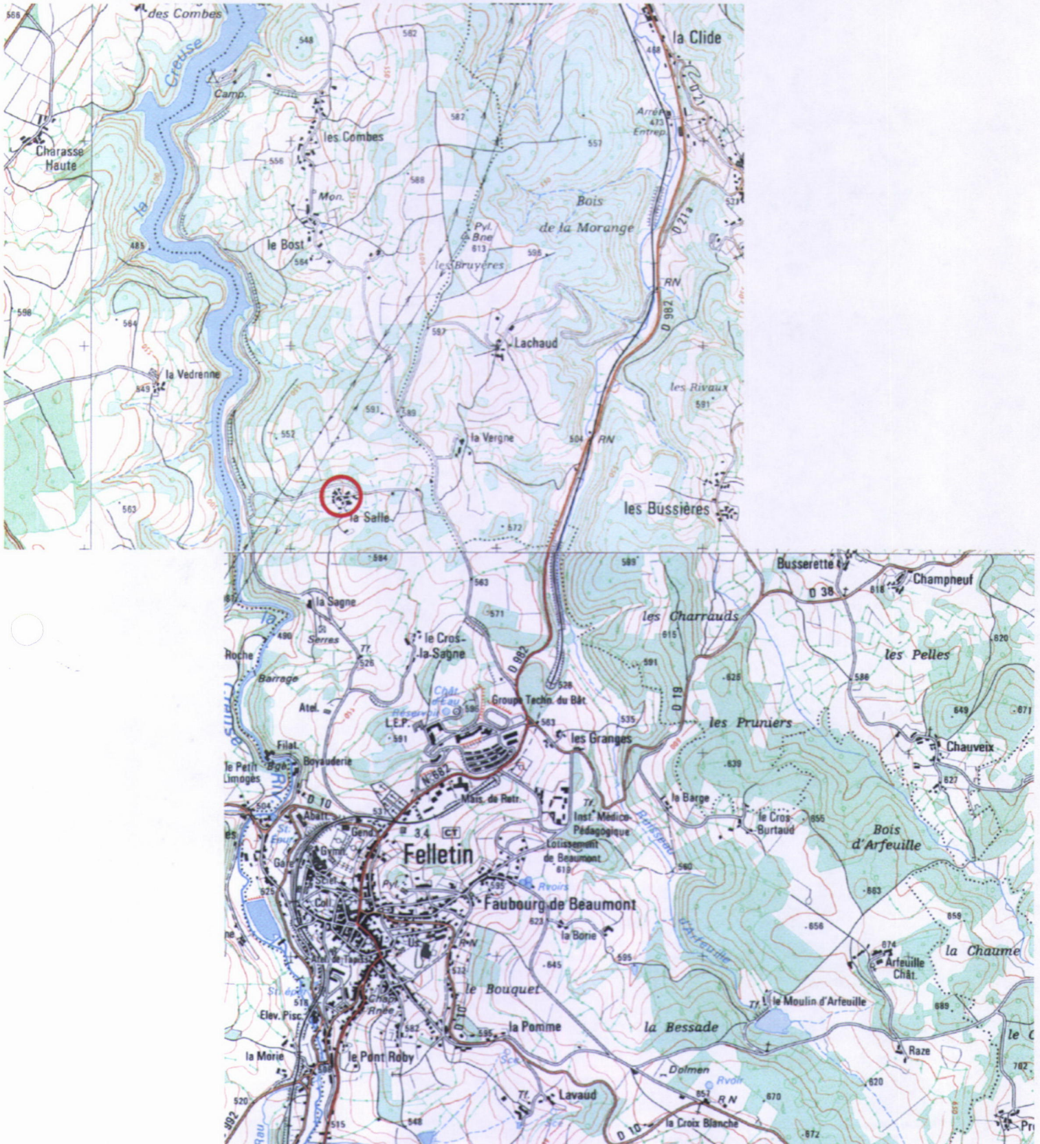
Des. 1 Carte I.G.N. au 1/25000è, 2330 Ouest Localisation du village de La Salle.