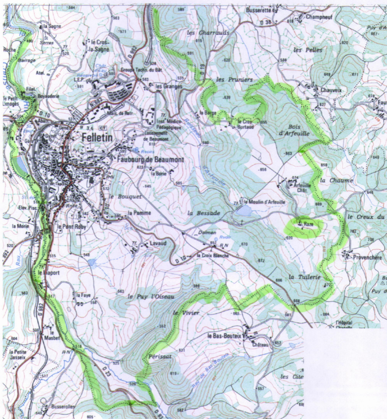
Des. 1 Carte I.G.N. au 1/25000è, 2331 Ouest Localisation de la ferme de Raze, sélectionnée.