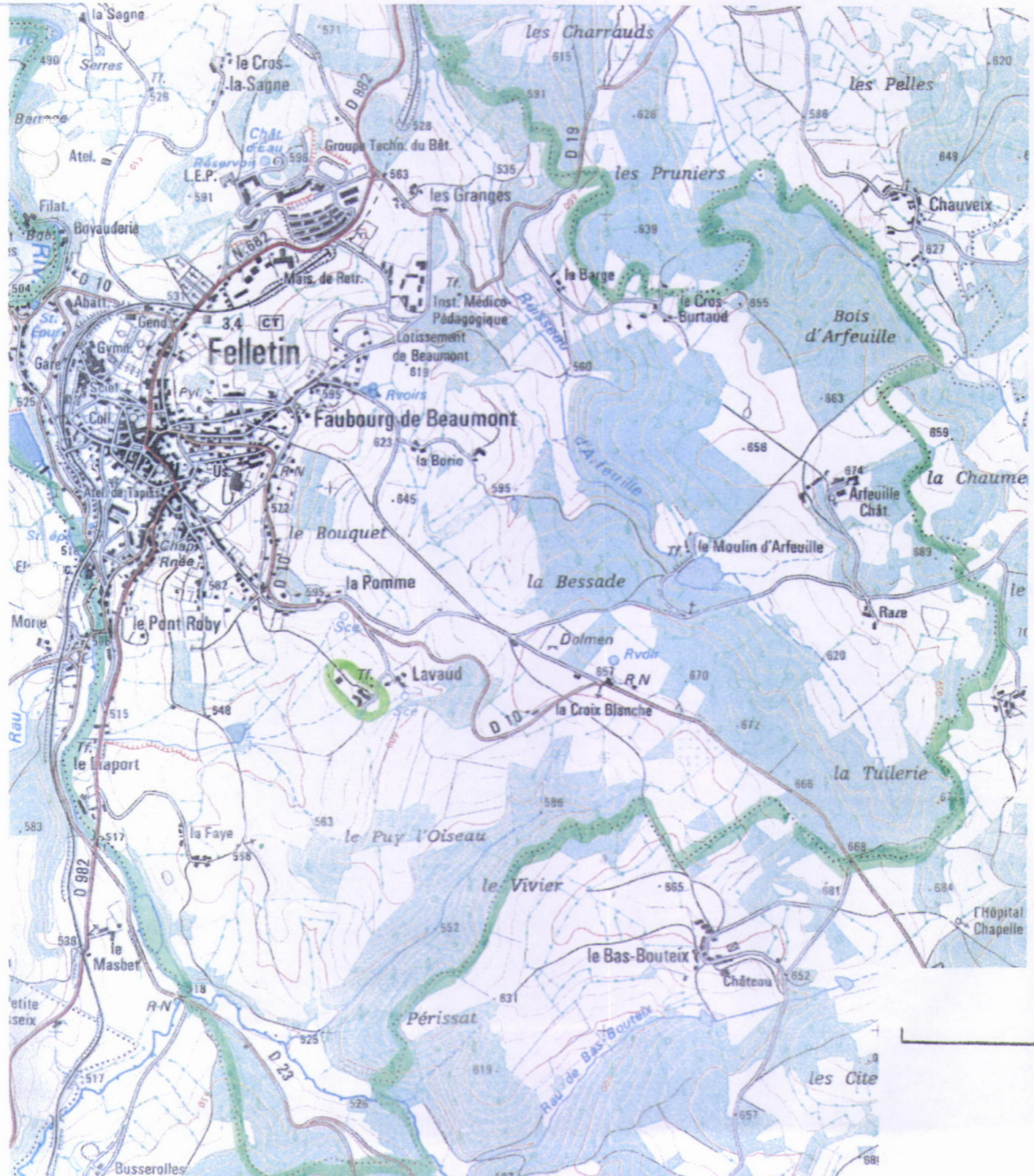
Des.1 Carte IGN au 1/25000è, 2331 Ouest. Localisation de la ferme de Lavaud.