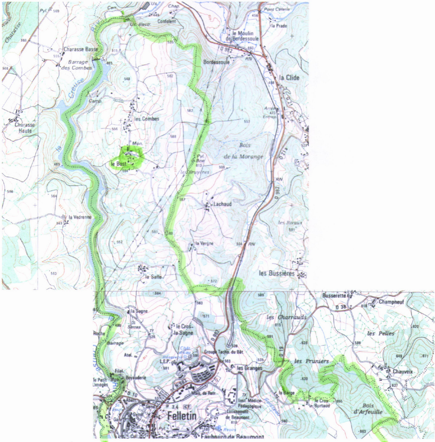
Des. 1 Carte I.G.N. au 1/25000 e ; 2330 ouest Localisation de la deuxième ferme du Bost, étudiée.