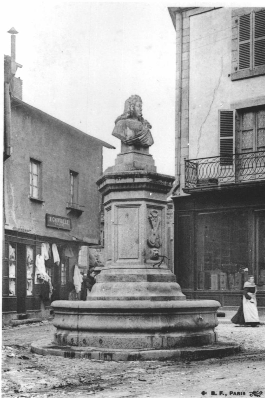
7 - Felletin - Fontaine Quinault