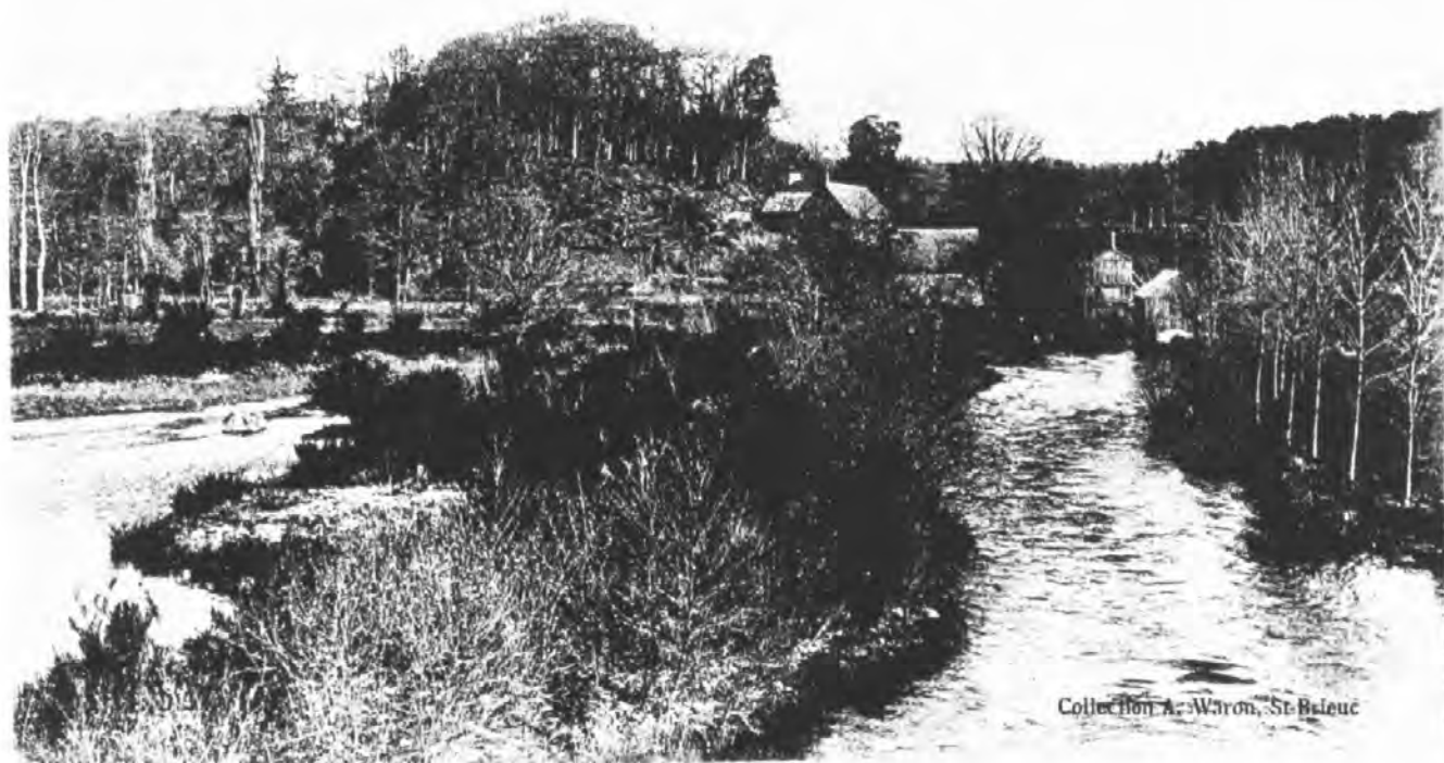
LA BRETAGNE PITTORESQUE 7166 Le Scorff à Tronchâteau, près PONT-SCORFF