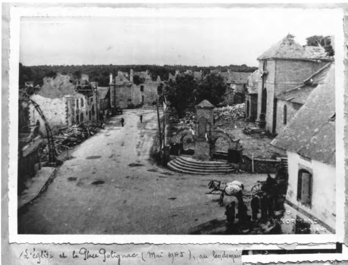
L'église et la Place Polignac (Mai 1945), au lendemain

Doc. 6 L'église, le monument aux morts et la place Polignac. Repr. Inv. B. Bègne Mai 1945. Reproduction, archives paroissiales. 99 56 0809 X