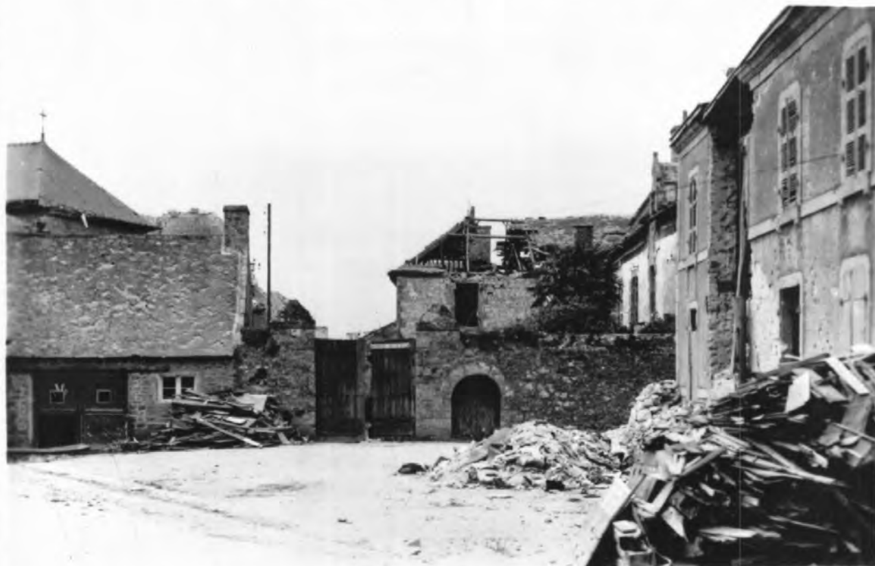
Guidel. - Au fond à droite. le vieux presbytère. - Au 1 er

semble plutôt que de lui faire des réparations qui en occasionneraient à l'état des dépenses considérables.