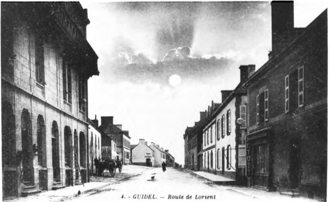
4. - GUIDEL. — Route de Lorient