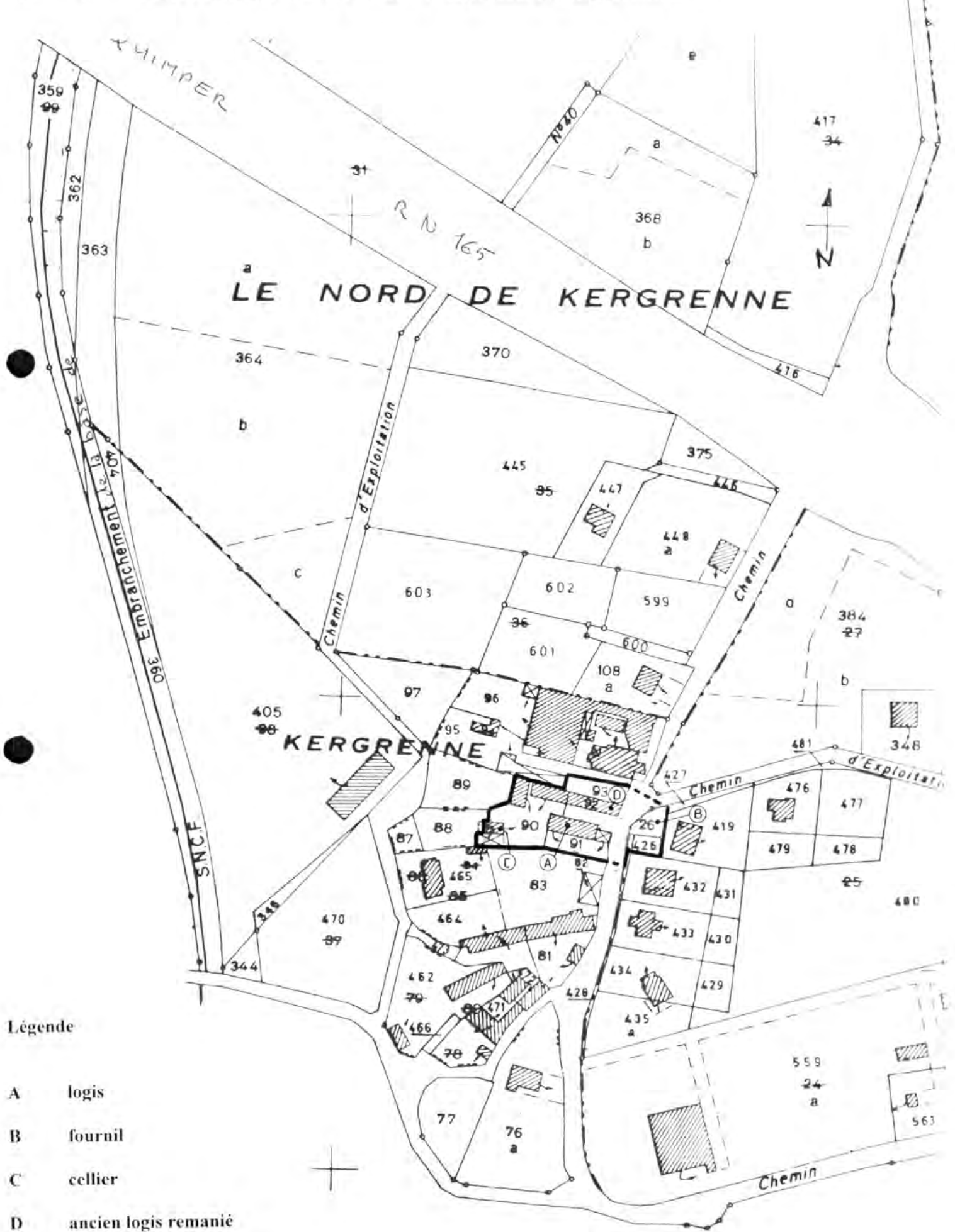
Pl I Plan de situation. Extrait cadastral 1980, section ZS, échelle 1/2000 e