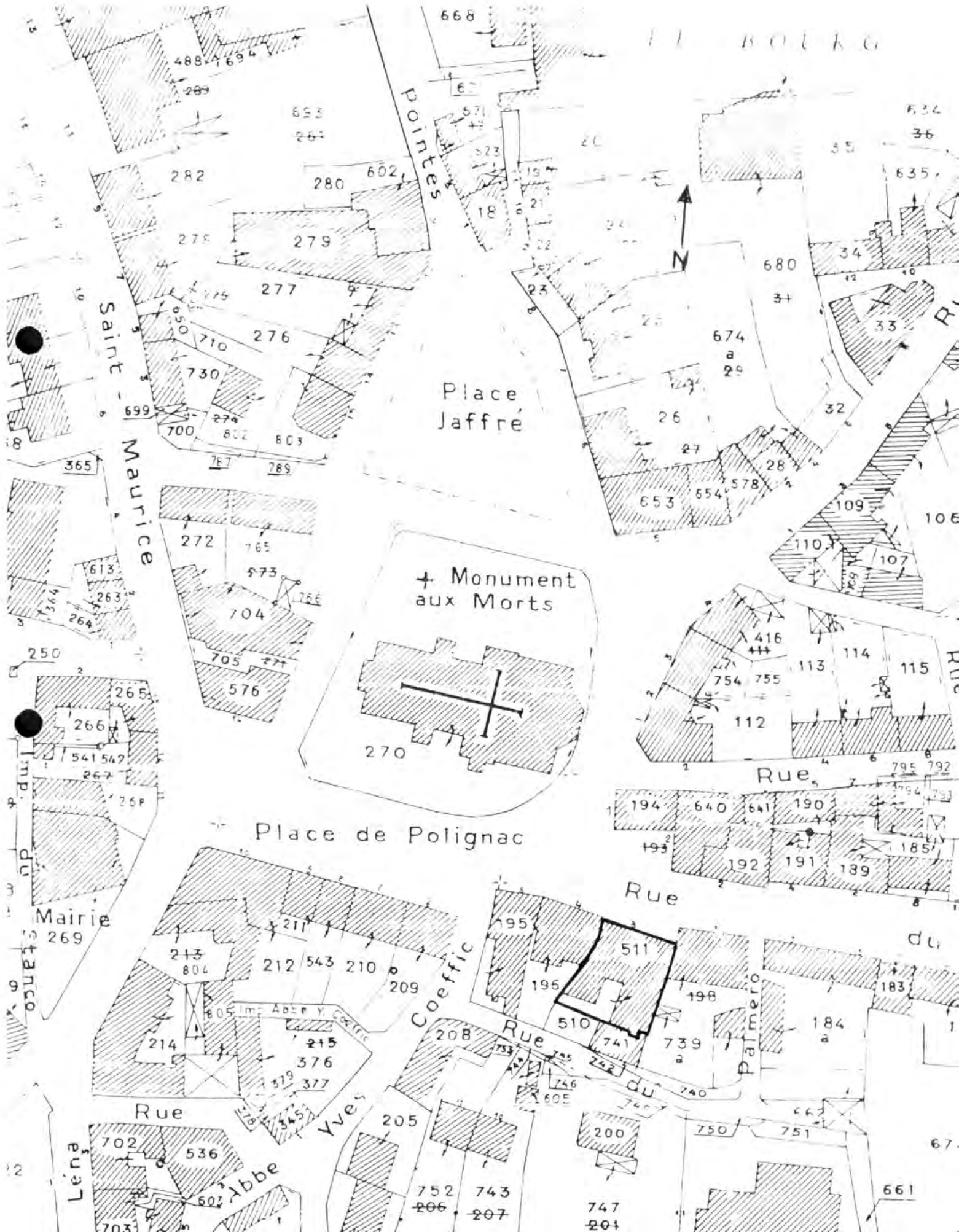
Pl. I Plan de situation. Extrait cadastral 1996, section AC, échelle 1/1000 e .