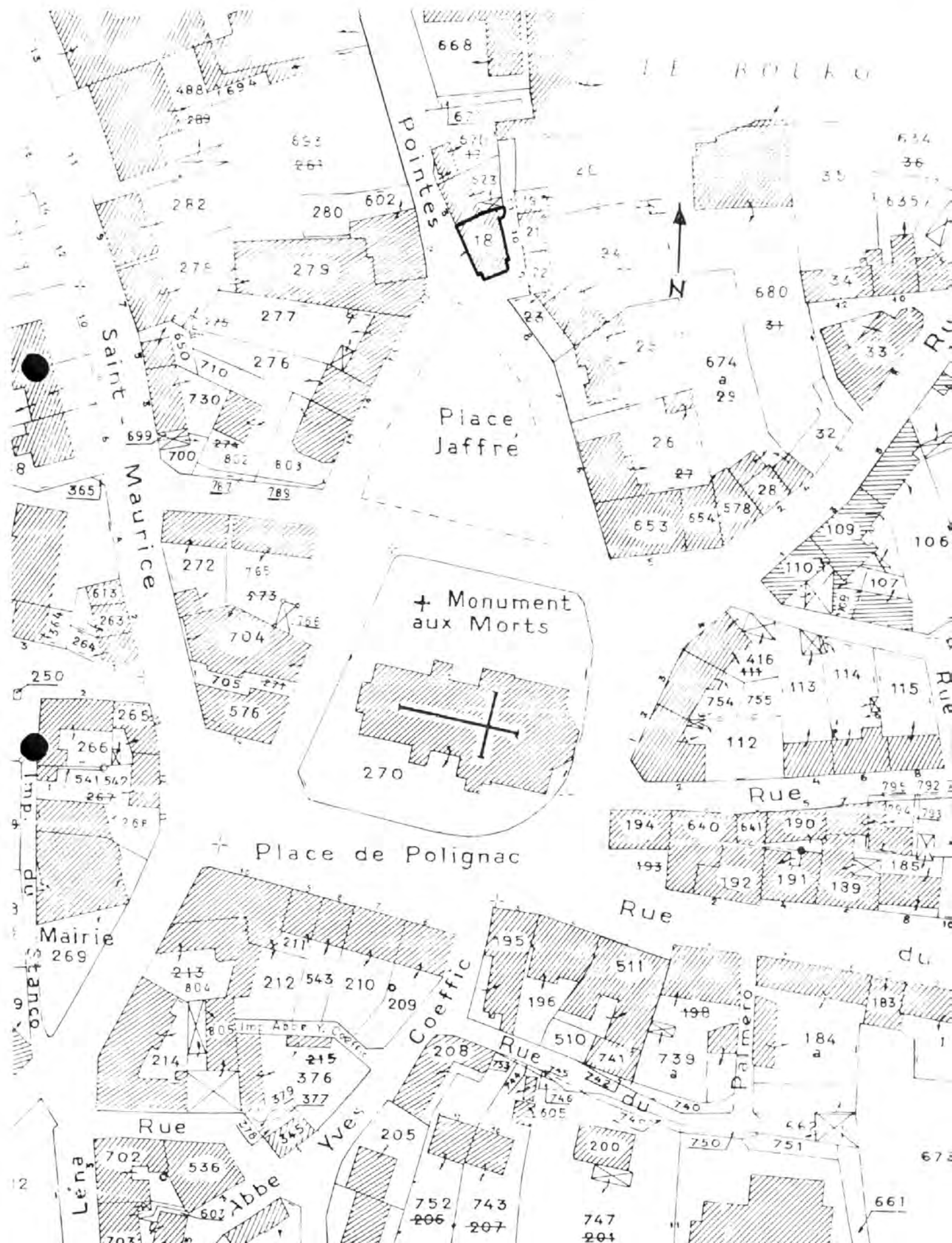
Pl. I Plan de situation. Extrait cadastral 1996, section AC, échelle 1/1000°