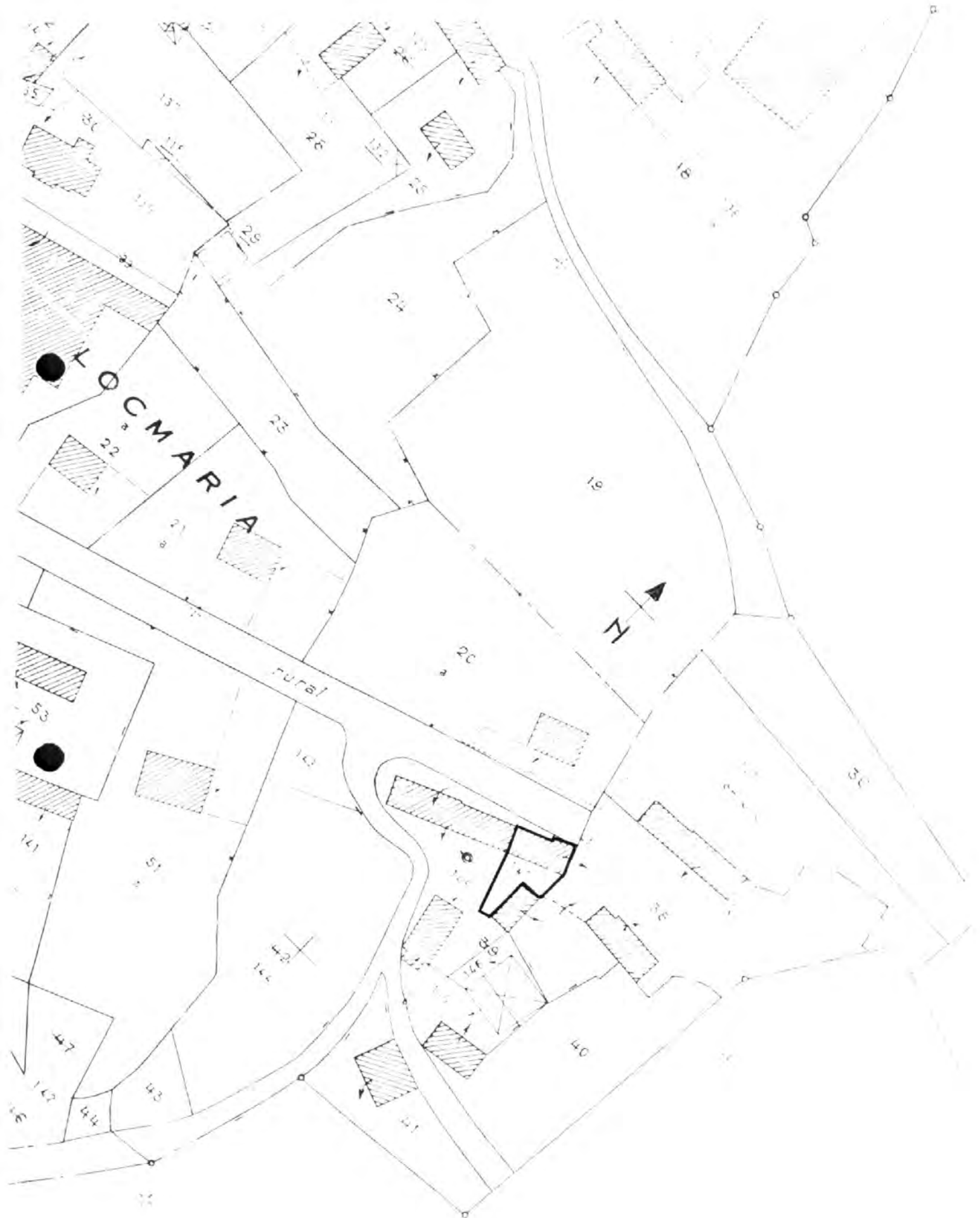
Pl. I Plan de situation. Extrait cadastral 1996, section AB, échelle 1/1000 e