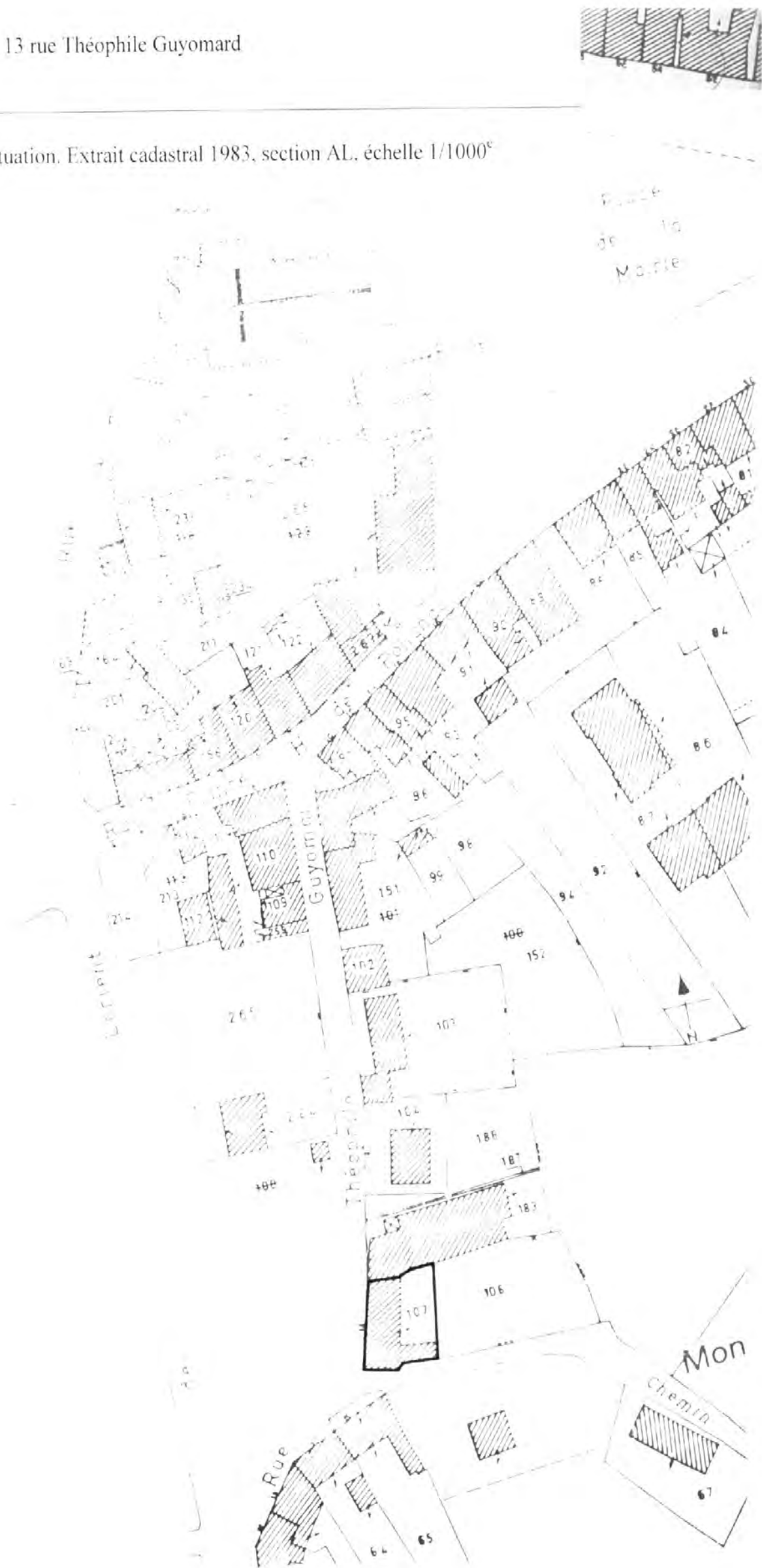
Pl. I Plan de situation. Extrait cadastral 1983, section AL, échelle 1/1000 e