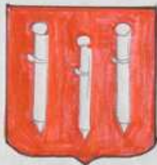
De gueules à trois bourdons d'argent en pal (seau 1375)