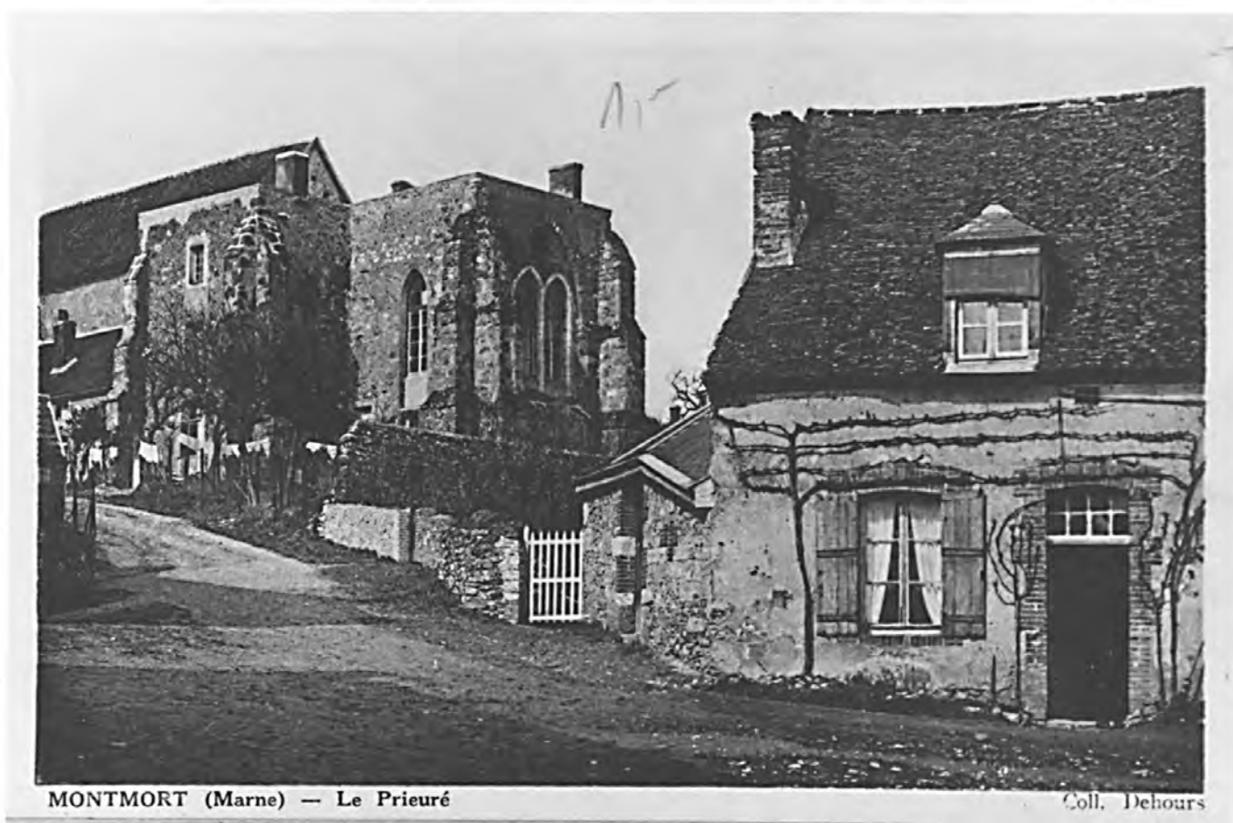
MONTMORT (Marne) — Le Priuré