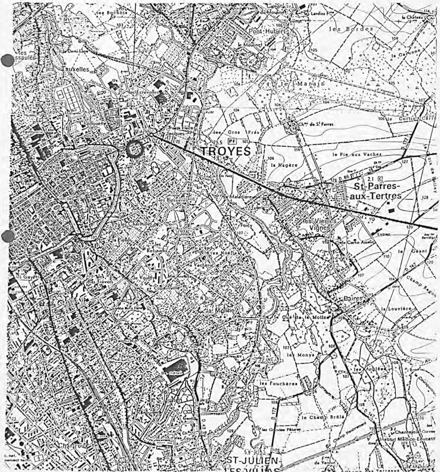
Pl. I : Carte de localisation de l'oeuvre Carte topographique, I.G.N., 1977, 1/25 000e Troyes, 2817 ouest