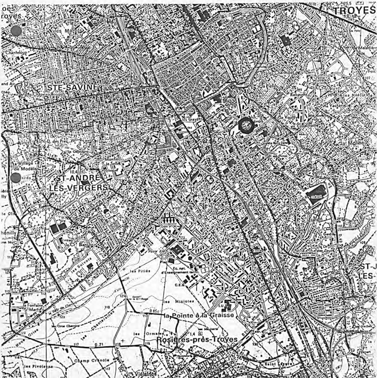
Pl. I : Carte de localisation de l'oeuvre Carte topographique, I.G.N., 1977, 1/25 000e Troyes, 2817 ouest