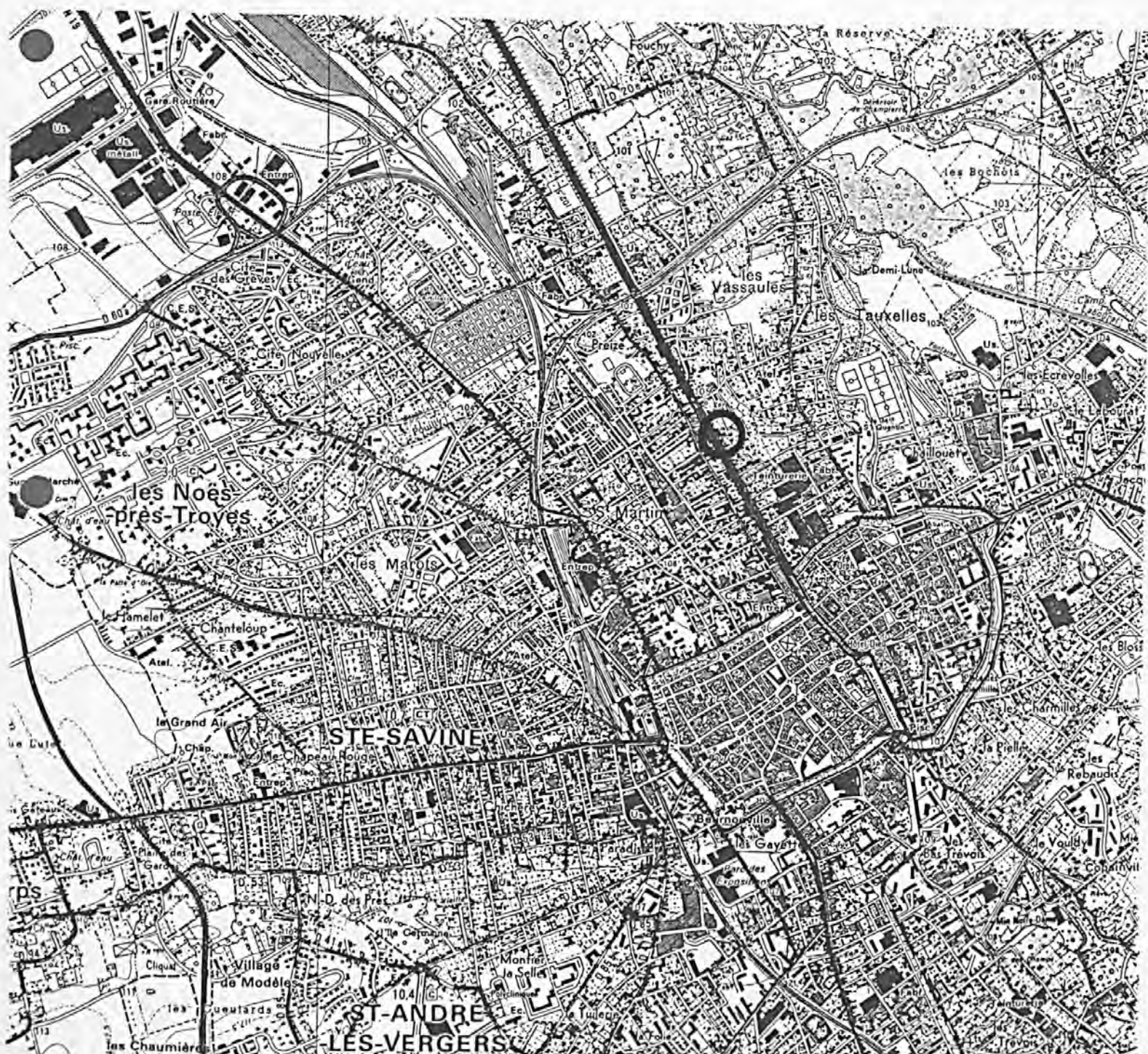
Pl. I : Carte de localisation de l'oeuvre Carte topographique, I.G.N., 1977, 1/25 000e Troyes, 2817 ouest