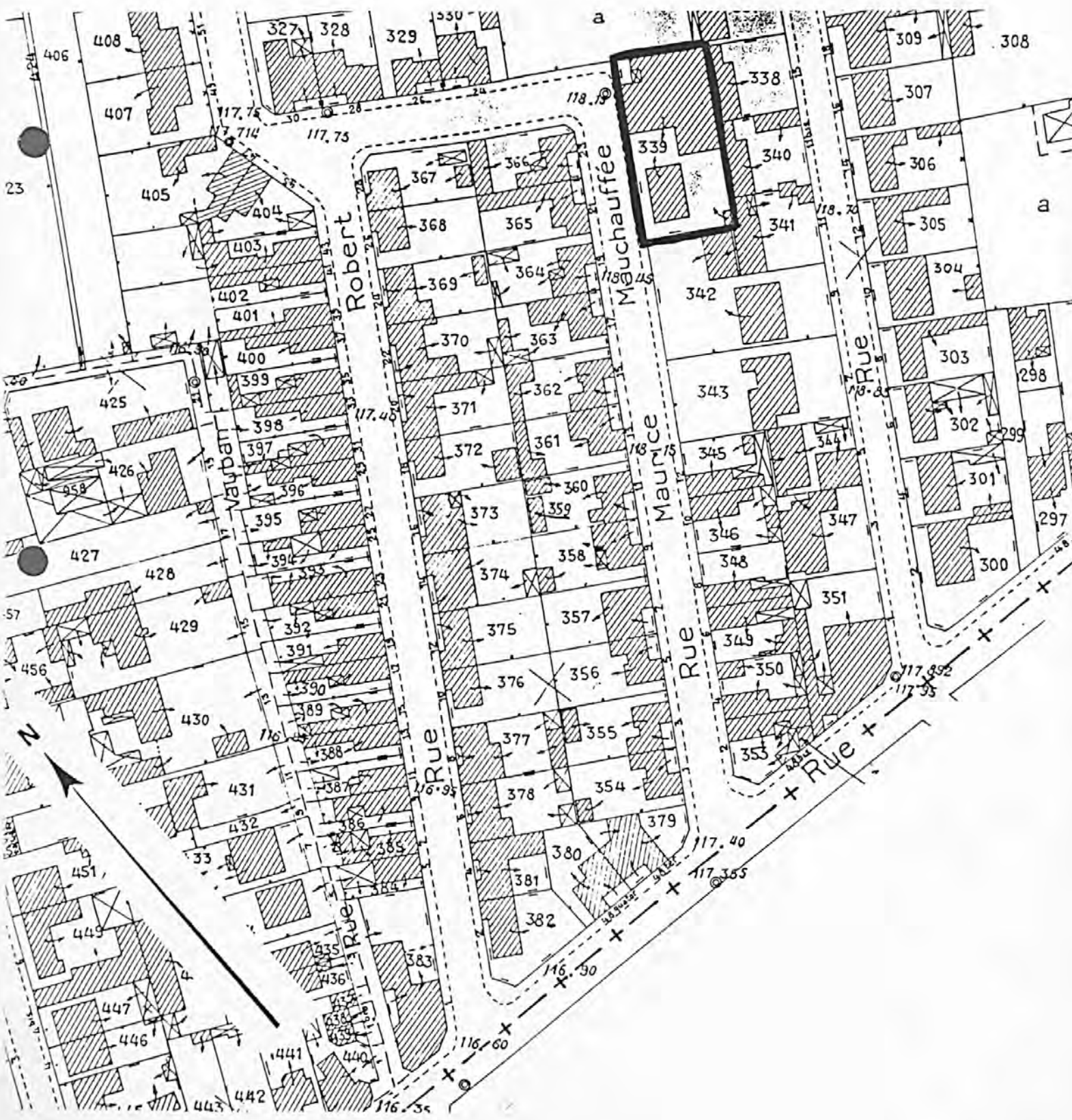
Pl. II : Plan de situation Extrait du cadastre, 1983 Section BP, 1/1 000e