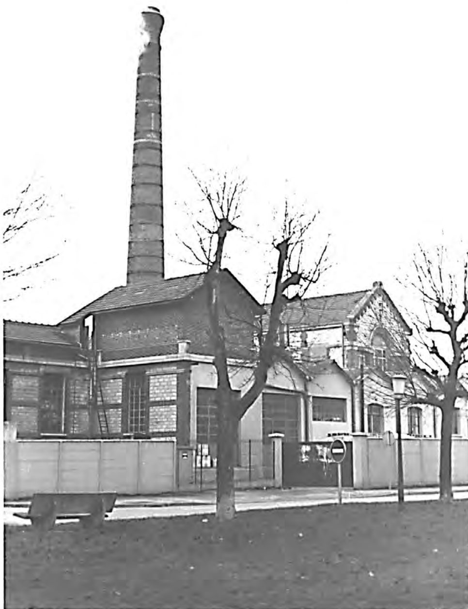
Fig. 3 : Salle des machines et cheminée d'usine vues depuis le nord 86.10.1282 Z