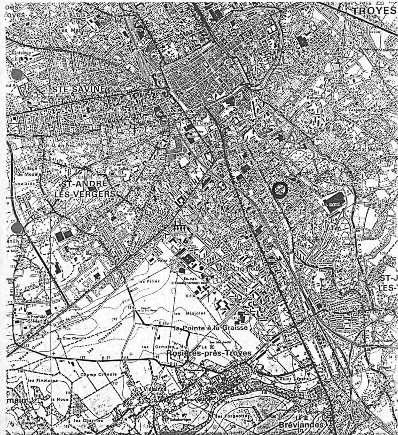
Pl. I : Carte de localisation de l'oeuvre Carte topographique, I.G.N., 1977, 1/25 000e TroYES, 2817 ouest