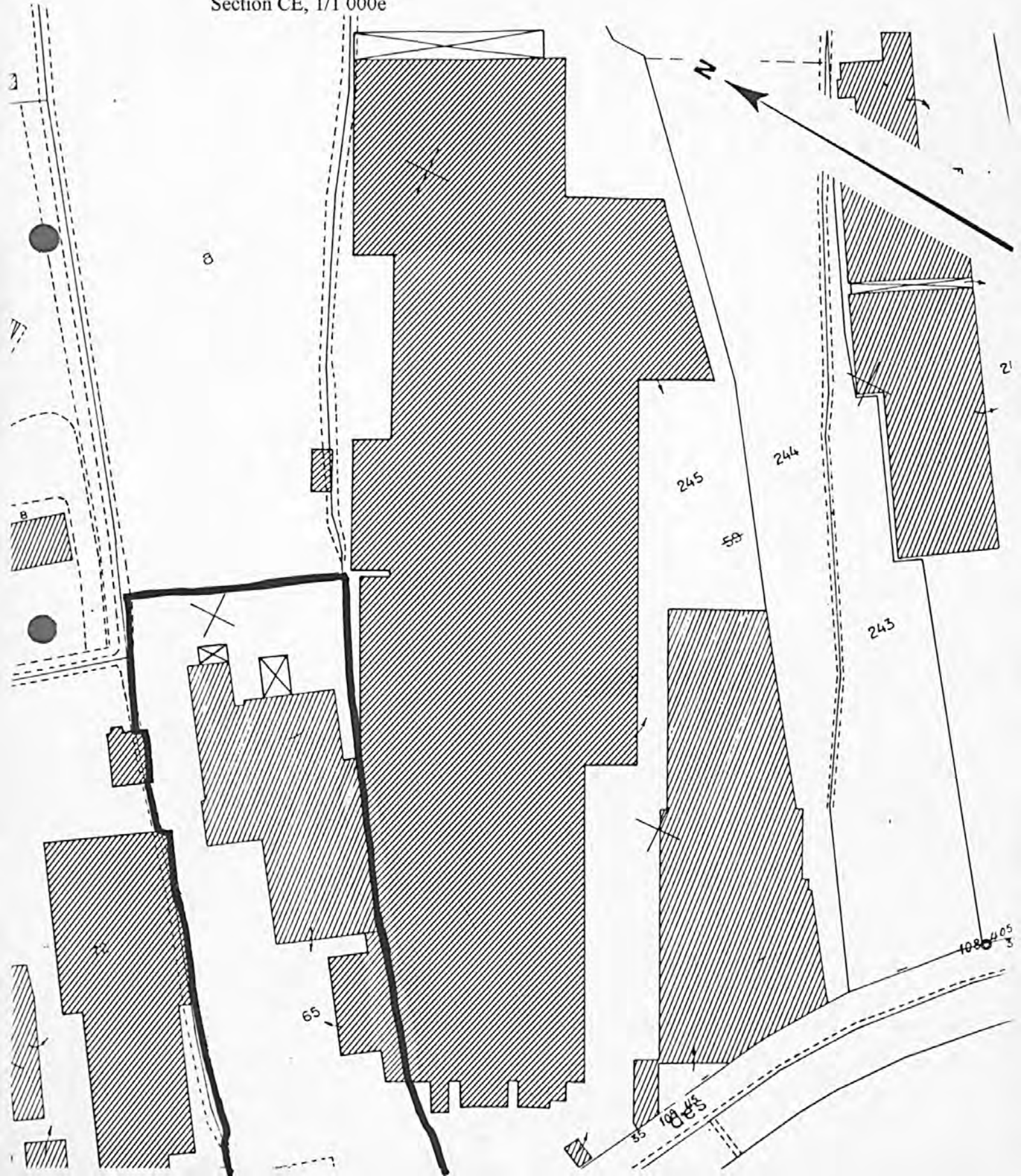
Pl. II : Plan de situation Extrait du cadastre, 1983 Section CE, 1/1 000e