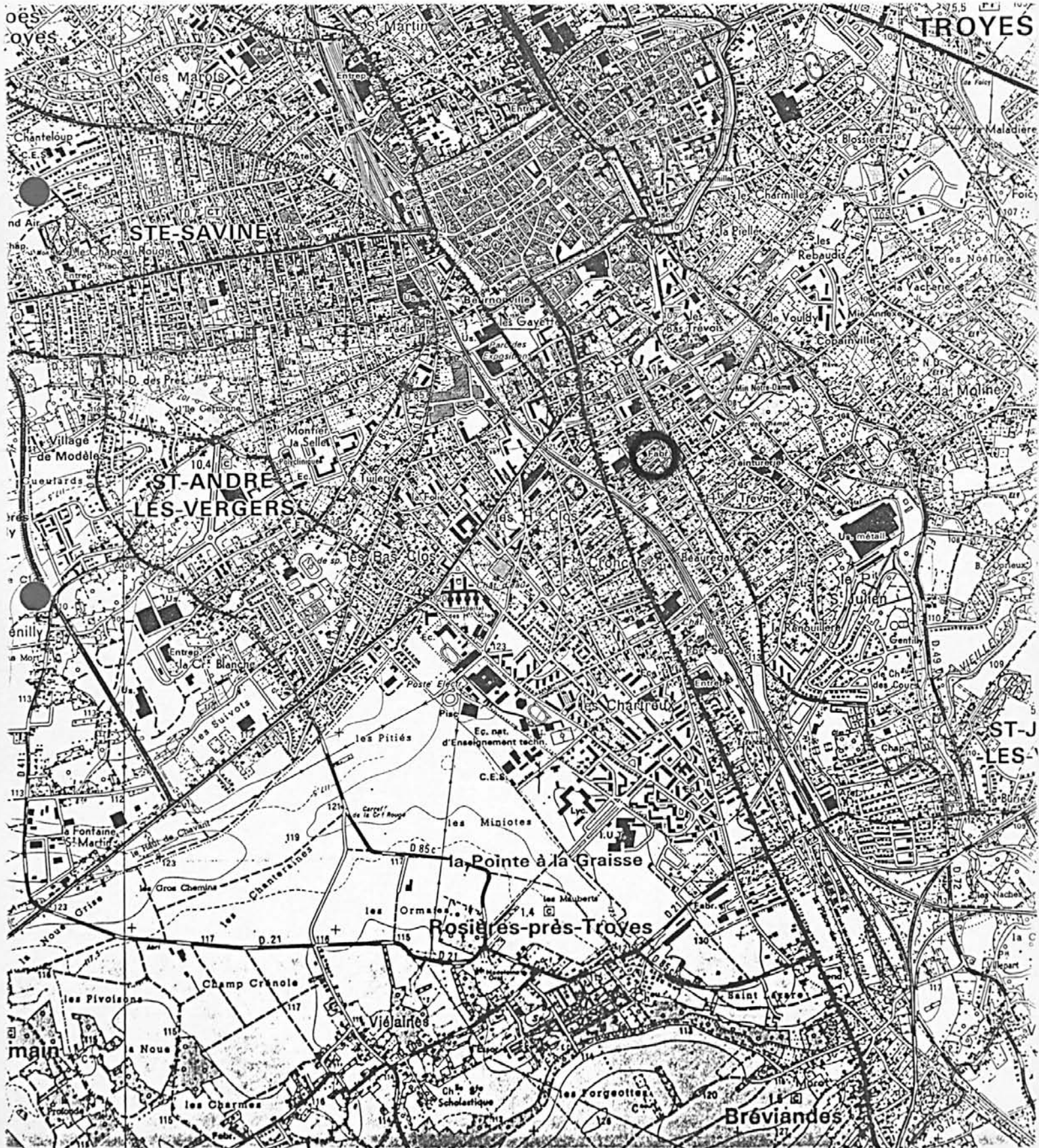
Pl. I : Carte de localisation de l'oeuvre Carte topographique, I.G.N., 1977, 1/25 000e TroYES, 2817 ouest