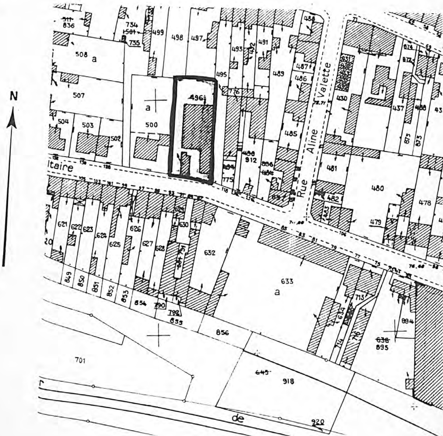
Pl. II : Plan de situation Extrait du cadastre, 1985 Section BC, 1/1 000e