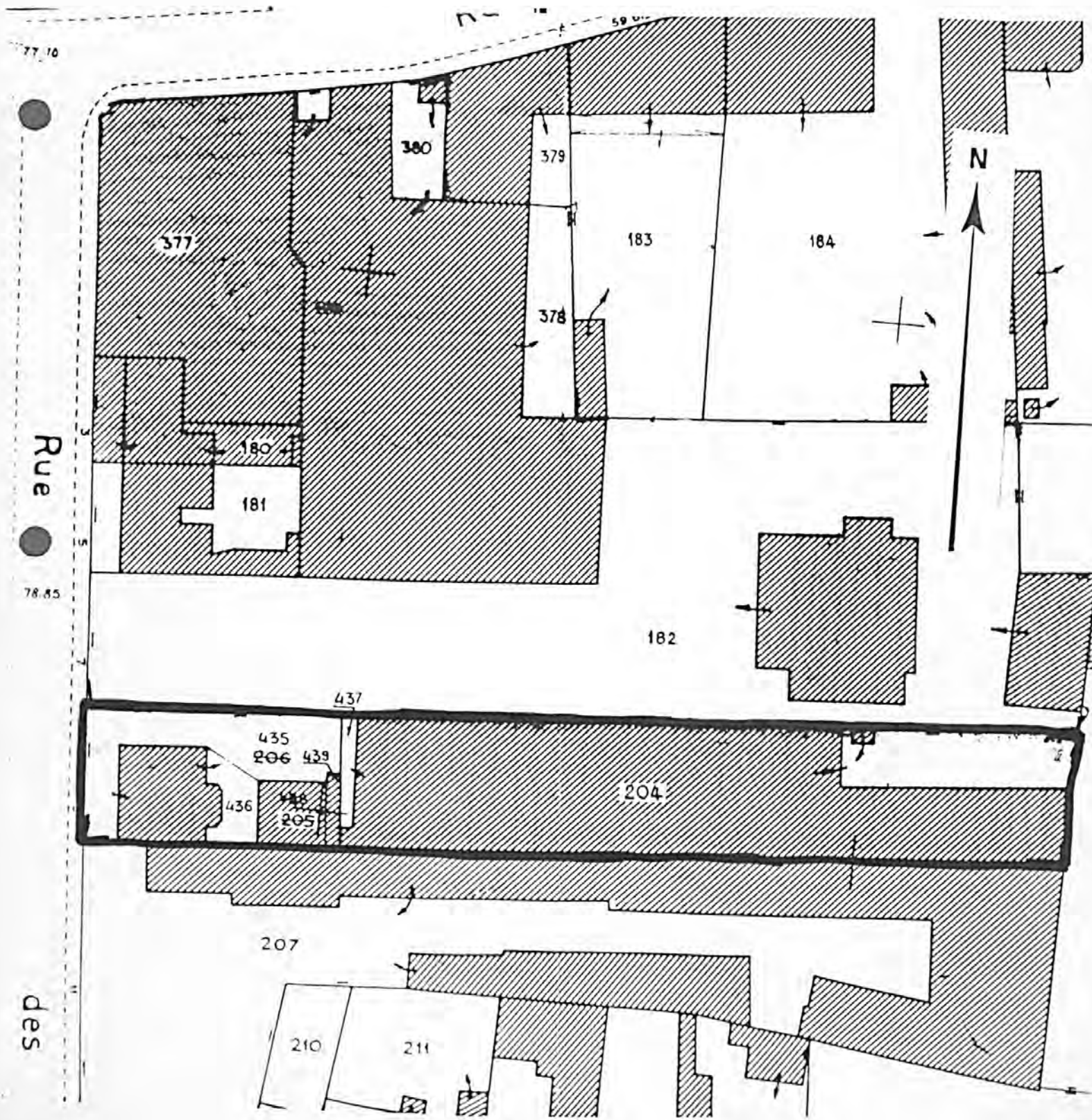
Pl. II : Plan de situation Extrait du cadastre, 1985 Section AZ, 1/500e