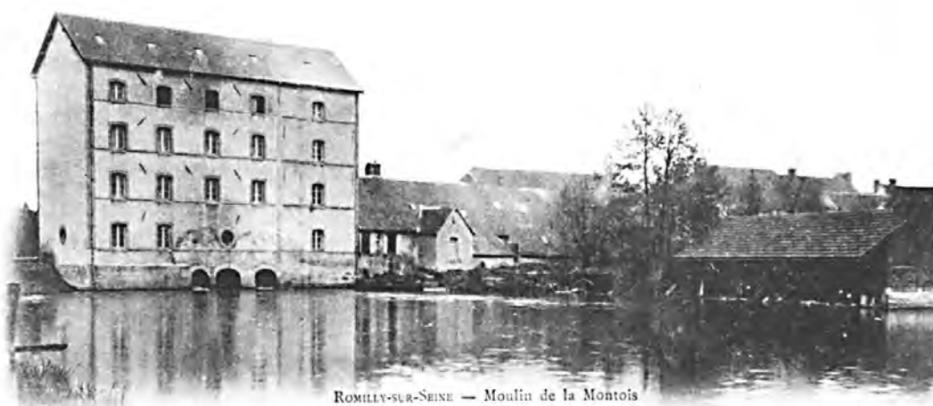
ROMILLY-SUR-SEINE — Moulin de la Montois