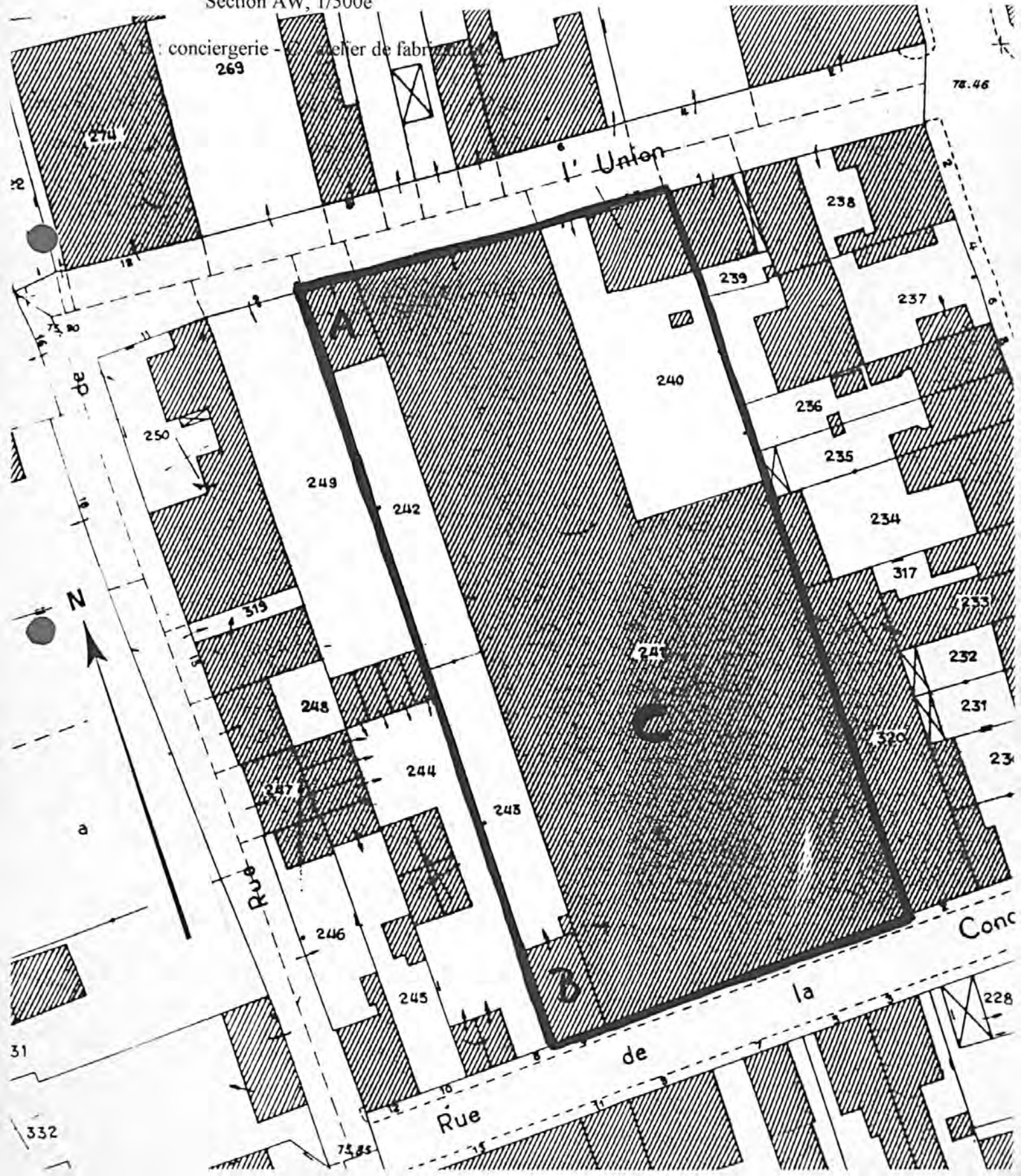
Pl. II : Plan de situation Extrait du cadastre, 1985 Section AW, 1/500e