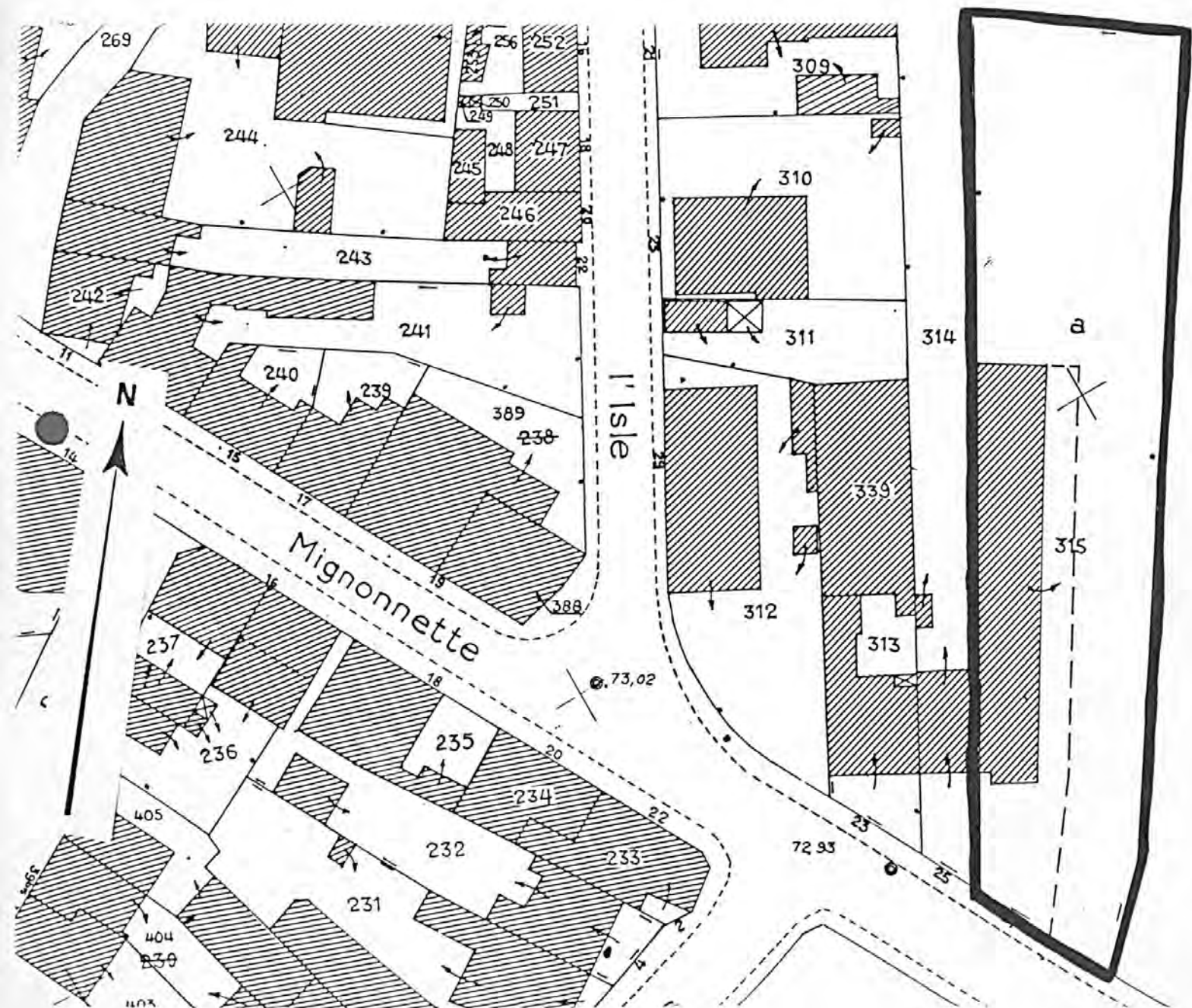
Pl. II : Plan de situation Extrait du cadastre, 1985 Section AT, 1/500e