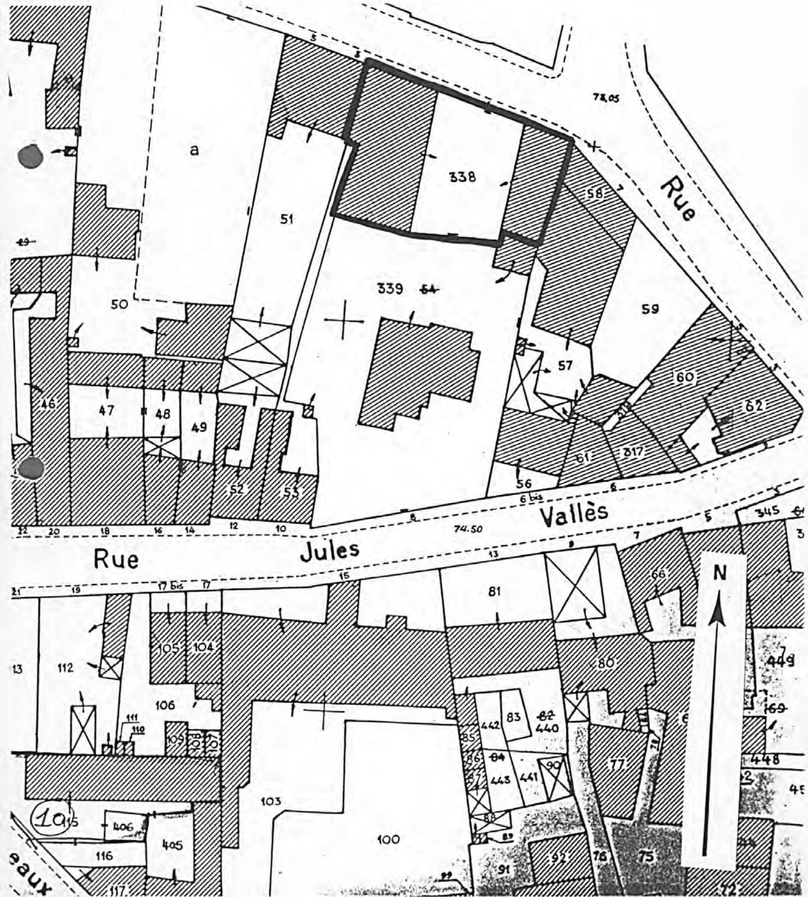
Pl. II : Plan de situation Extrait du cadastre, 1985 Section AZ, 1/500e