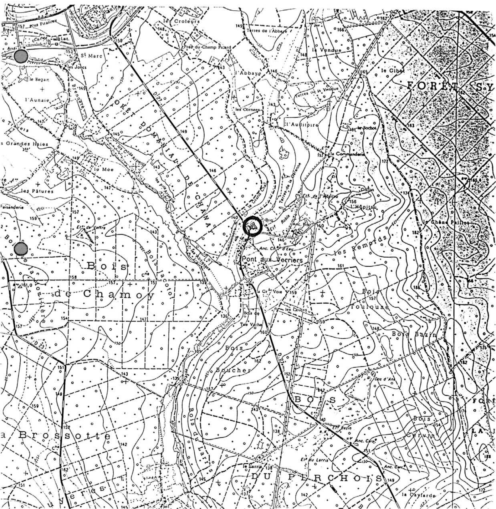
Pl. I : Carte de localisation de l'oeuvre Carte topographique, I.G.N., 1983, 1/25 000e Bouilly, 2818 ouest