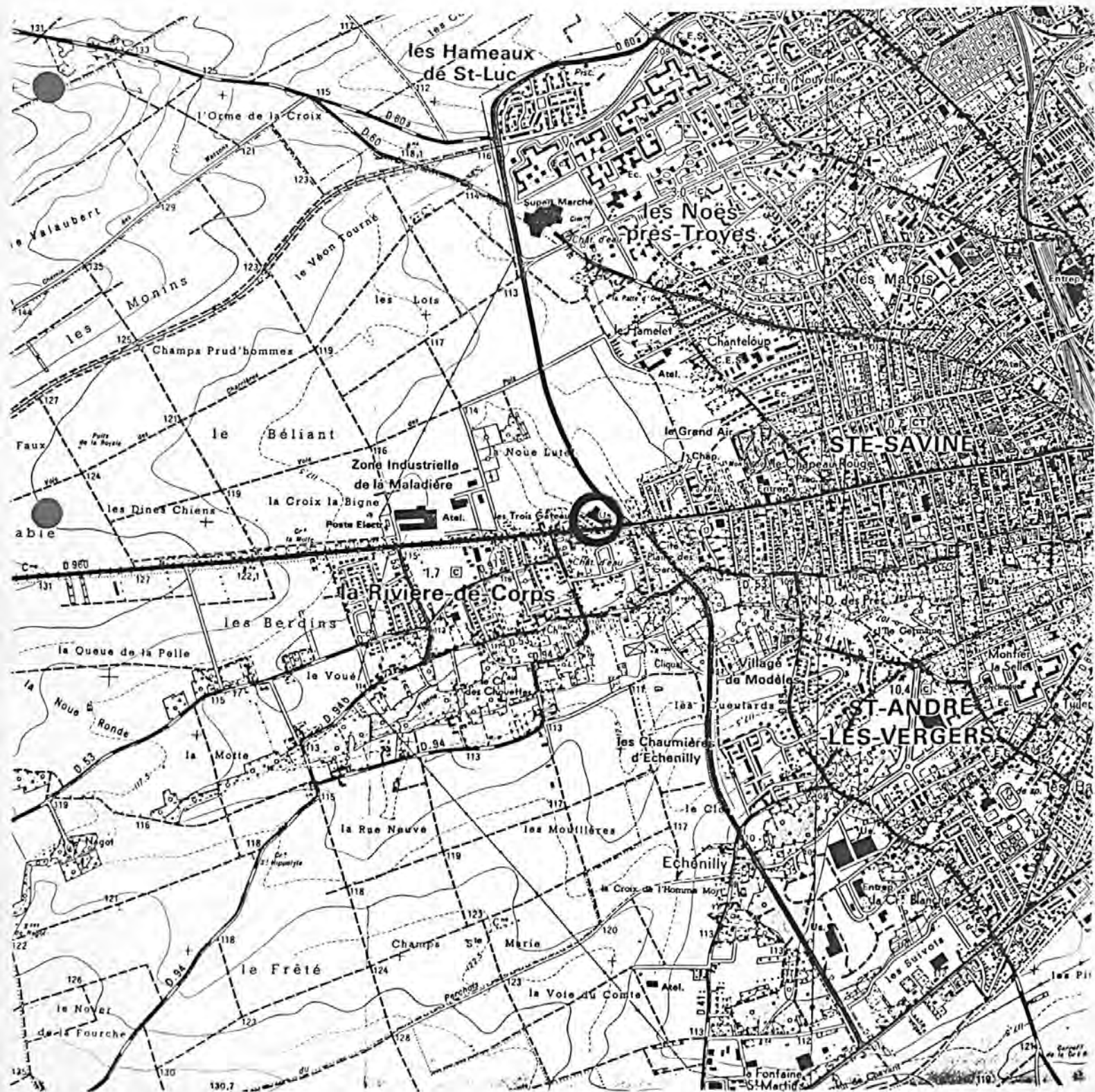
Pl. I : Carte de localisation de l'oeuvre Carte topographique, I.G.N., 1977, 1/25 000e Troyes, 2817 ouest