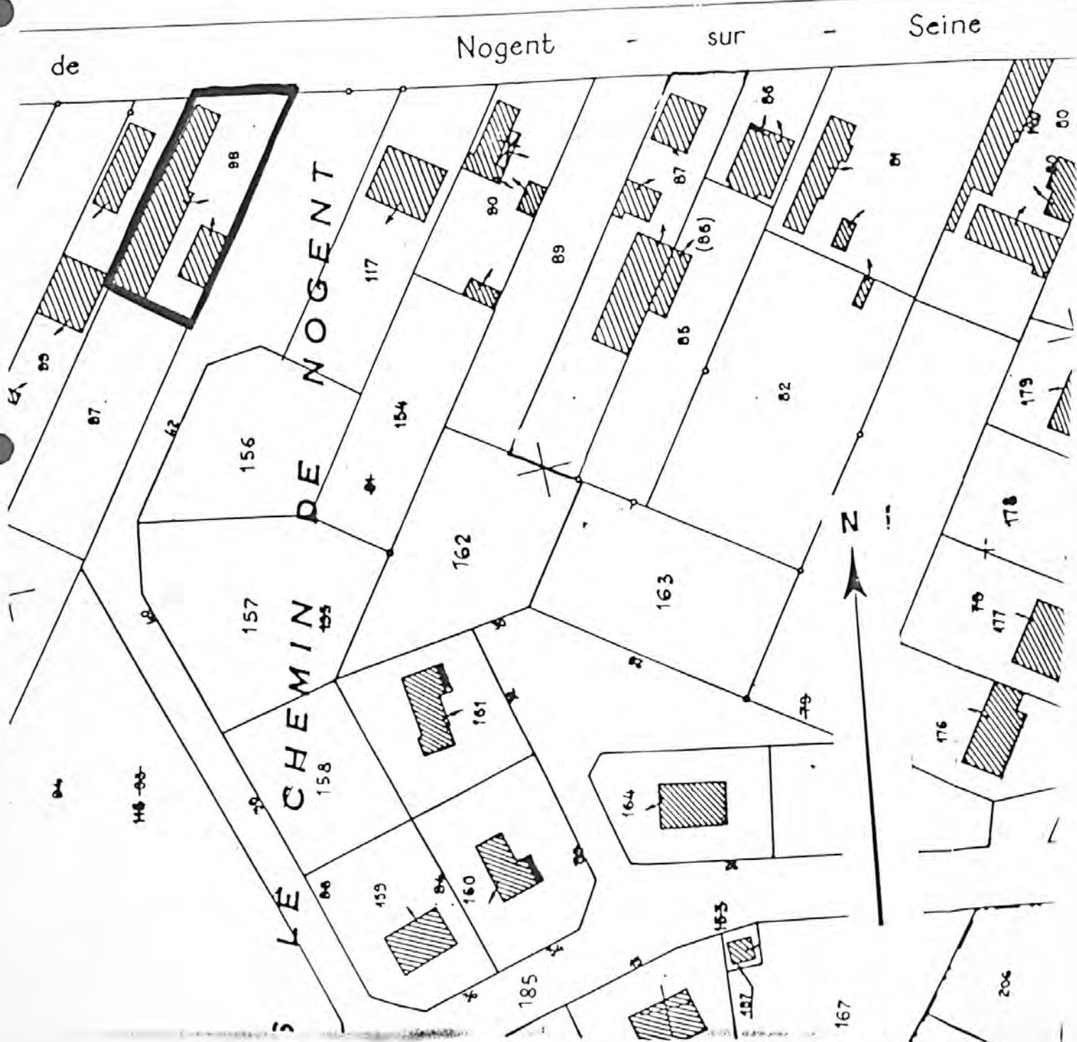
Pl. II : Plan de situation Extrait du cadastre, 1980 Section AH, 1/1 000e