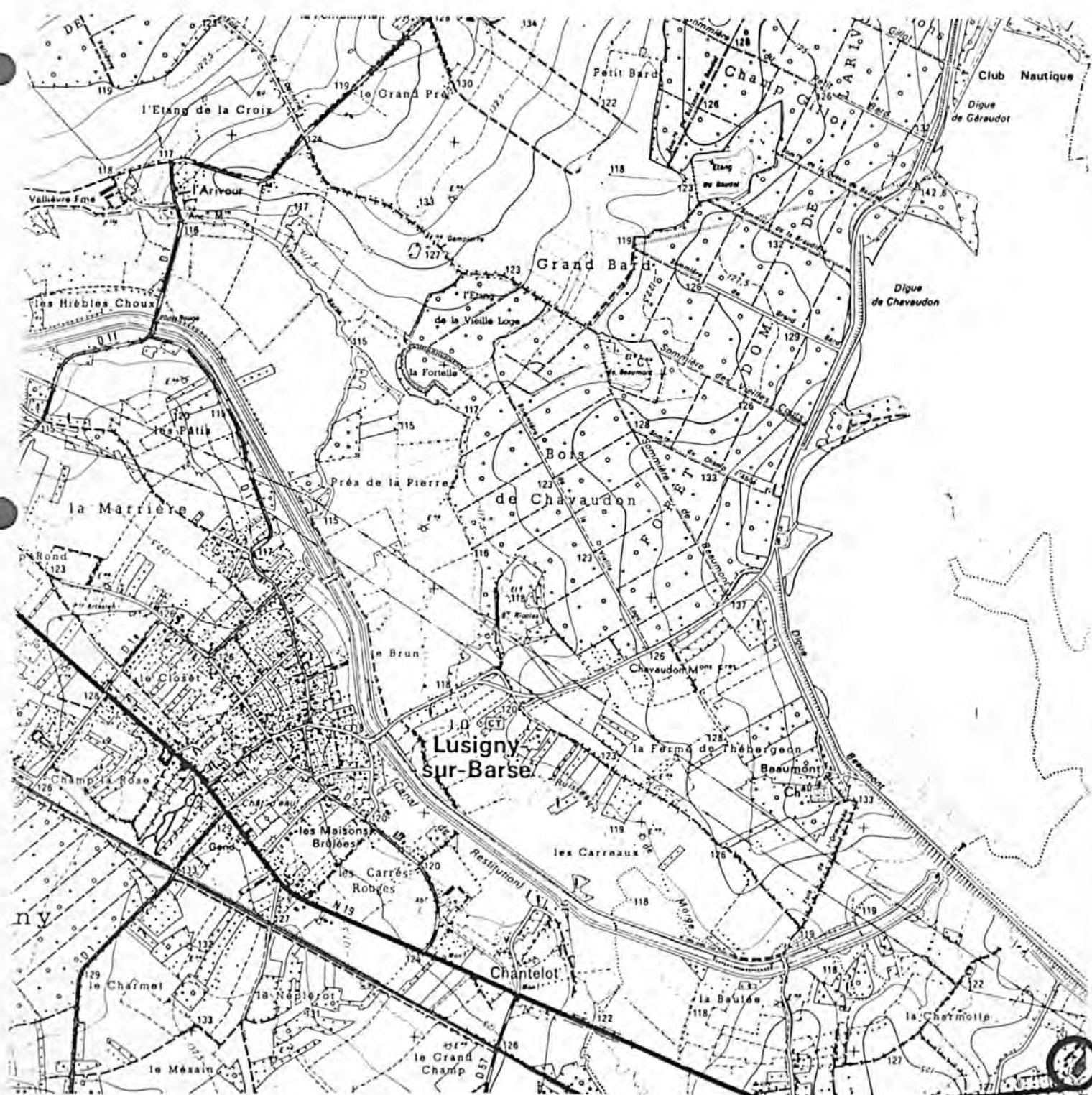
Pl. I : Carte de localisation de l'oeuvre Carte topographique, I.G.N., 1977, 1/25 000e Troyes, 2817 est