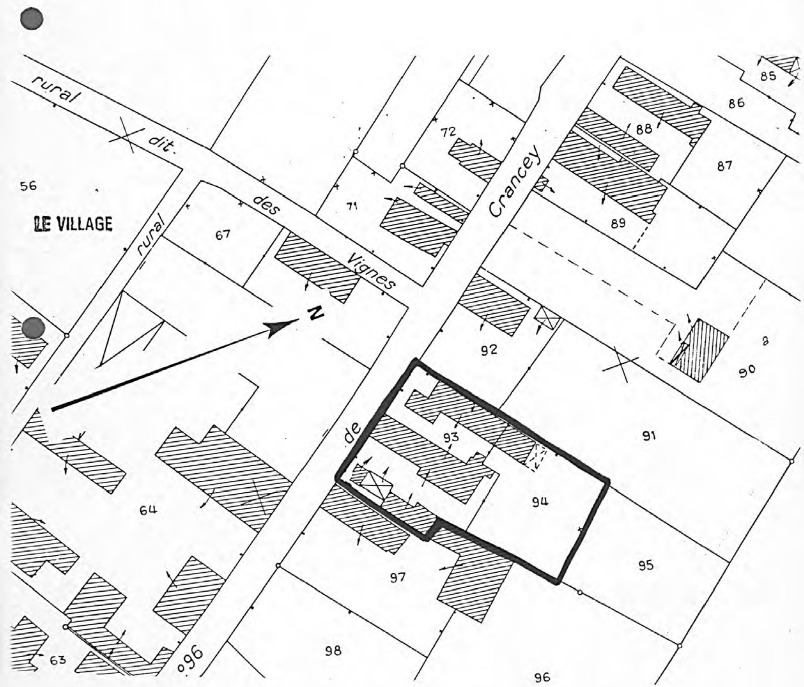
Pl. II : Plan de situation Extrait du cadastre, 1985 Section AC, 1/1 000e